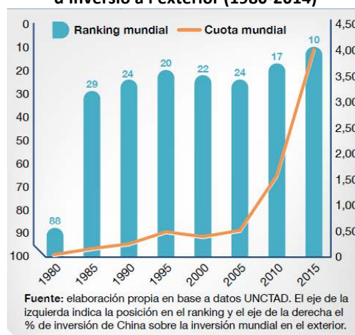
Posició de Xina en la classificació mundial d'inversió a l'exterior (1980-2014)

Font: "Tendencias de la inversión china en Europa. Informe 2016-17". ESADE China Europe Club