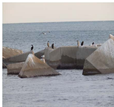
Imatges del Corb marí emplomallat a l'illa de l'espigó del Bogatell

L'any 2001, l'Ajuntament de Barcelona va fer un primer informe sobre l'estat dels fons marins i la seva biodiversitat i al 2016 se n'ha fet una actualització. D'aquest estudi s'evidencia que en aquests darrers 15 anys hi ha hagut una millora de la qualitat ambiental dels fons marins del front litoral de Barcelona, a nivell de la qualitat química, biològica i física