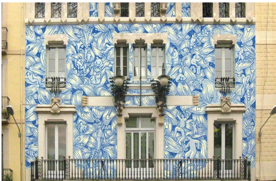
Imatge virtual del projecte

Els referents de la proposta de Reskate Arts & Crafts són els colors i els liris de l'escut de Gràcia, el procés de guarnits dels carrers i els valors que representen, els esgrafiats d'alguns dels edificis dels carrers i les auques com a expressió artística. Reskate Arts & Crafts proposen una intervenció a mode d'esgrafiat que recorda un paper de paret de liris amb escenes de preparació i muntatge dels guarnits i del moment de la Festa Major.