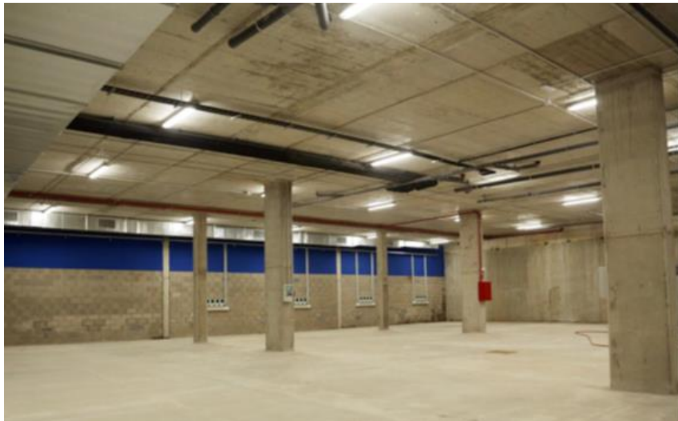
Aparcament i zona de càrrega dels vehicles elèctrics

L'edifici soterrat de dues plantes té com a ús principal el centre de neteja. A la planta soterrània hi ha l'aparcament amb la zona de càrrega elèctrica per als vehicles de la flota de neteja, una zona de gestió de residus amb un transferidor mecànic de contenidors i un dipòsit d'aigües freàtiques. A la planta a peu de carrer es troba l'espai d'oficines i logístic, els vestuaris i una sala polivalent.