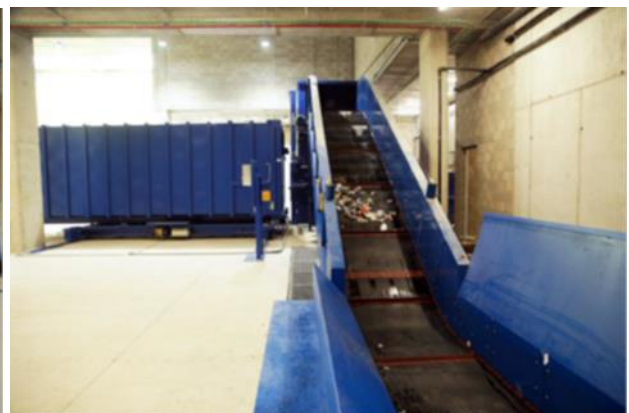
Zona de transferència de residus