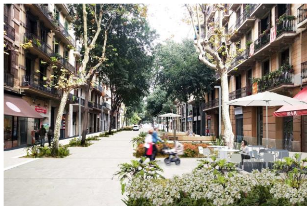
Proposta de futur: recreació virtual