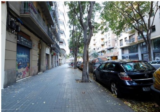
Situació Actual c/Viladomat

En un altre ordre, en aquesta segona fase d'intervenció també es duran a terme obres de millora de voreres i escocells i increment del verd urbà en diversos espais així com la millora de l'enllumenat als carrers Viladomat, entre Gran Via i Paral·lel i a Manso entre Paral·lel i Ronda de Sant Antoni . Les obres s'iniciaran al mes d'octubre de 2018 i finalitzaran al maig del 2019. Aquesta actuació té un pressupost de 2 M€.