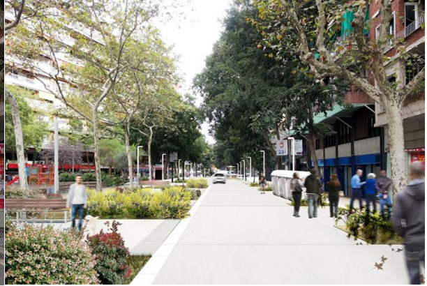
Proposta de futur: recreació virtual

A banda, també es vol dur a terme una actuació de reurbanització al tram del carrer Tamarit, comprès entre Comte d'Urgell i Villarroel , pendent de concretar els terminis. Aquesta actuació té un pressupost de 1,3 M€.