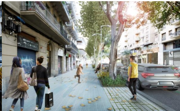
Proposta de Futur: Recreació Virtual