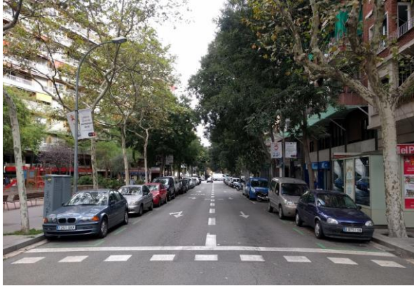
Situació Actual Tamarit/Calàbria