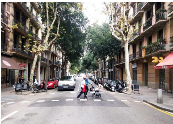
Situació- actual: Borrell/Floridablanca

A partir del mes d'octubre d'aquest any s'iniciarà una segona fase d'intervenció, ampliant les actuacions als carrers Comte Borrell, entre Gran Via i Floridablanca; i a Tamarit, entre Viladomat i Calàbria . En aquests espais s'aplicaran els mateixos criteris d'urbanització que a la resta de trams. Està previst que les obres finalitzin al mes de maig del 2019 i que tinguin un cost de 3,5 M€.