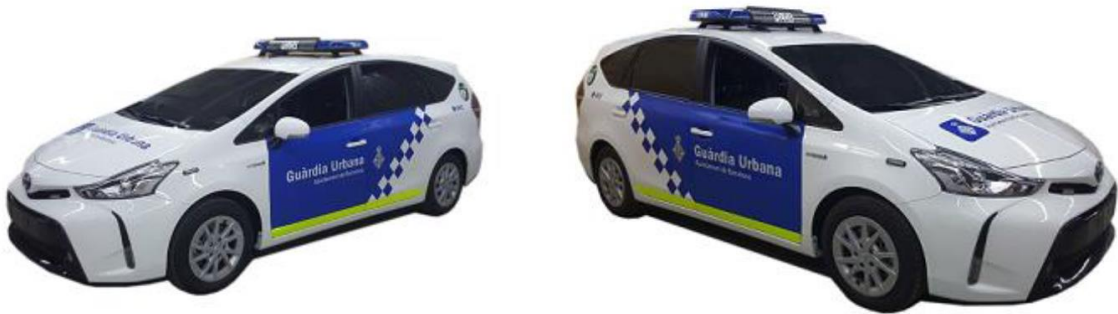
Marca: Toyota Prius+ (2018)