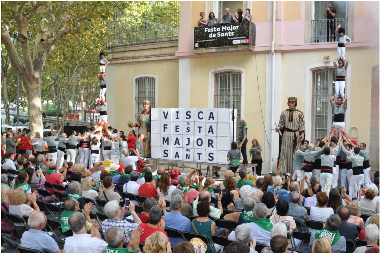
Lectura del pregó de la festa Major de Sants. Any 2017. Districte de Sant-Montjuïc