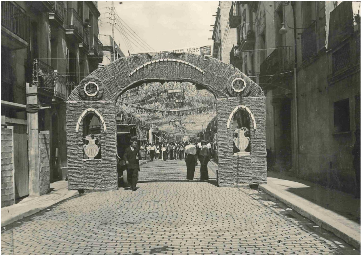
Carrer Galileu. Festa Major de Sants. Any 1934. Arxiu Municipal del Districte de Sants-Montjuïc