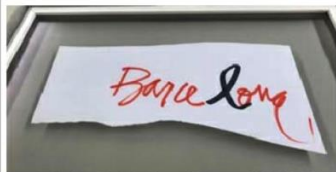
Logo de l'artista Frederic Amat_17 d'agost 2017.16:50h