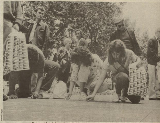
Centenars de barcelonins van formar el paviment de la rambla de Canaletes per condemnar l'atemptat

Sense perdre la calma, la ciutat ha condemnat unànimement l'acte