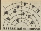
Assassinat en massa

Els crespons fets amb bosses d'escombraries han sortit arreu