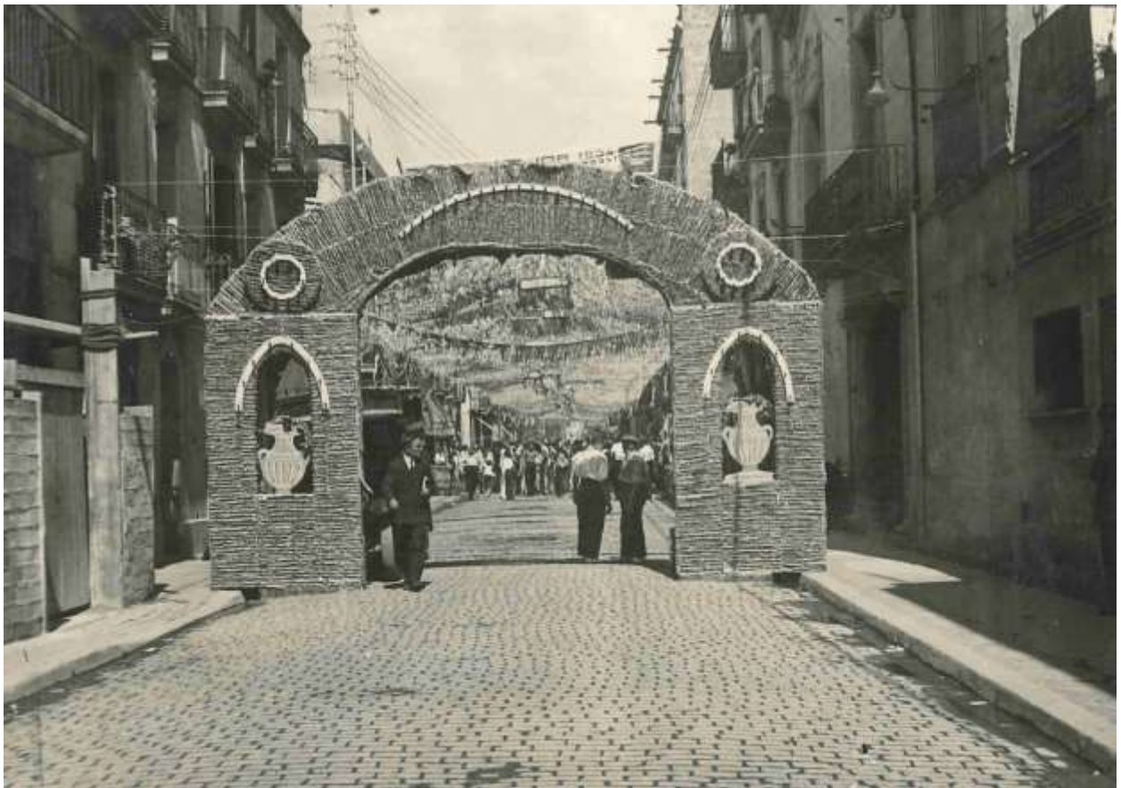
Carrer Galileu. Festa Major de Sants. Any 1934.

La festa es fa en honor de sant Bartomeu, patró de la vila. I ja se li dedicava la festa abans que la vila s'annexionés a Barcelona, l'any 1883. Segons el llegendari barceloní, va viure el martiri a Sants, com molts cristians més d'aquestes contrades, en l'època de l'emperador Dioclecià. A sant Bartomeu li van llevar la pell i, segurament per això, és considerat patró dels oficis relacionats amb el treball de la pell, com ara assaonadors, blanquers i adobadors.