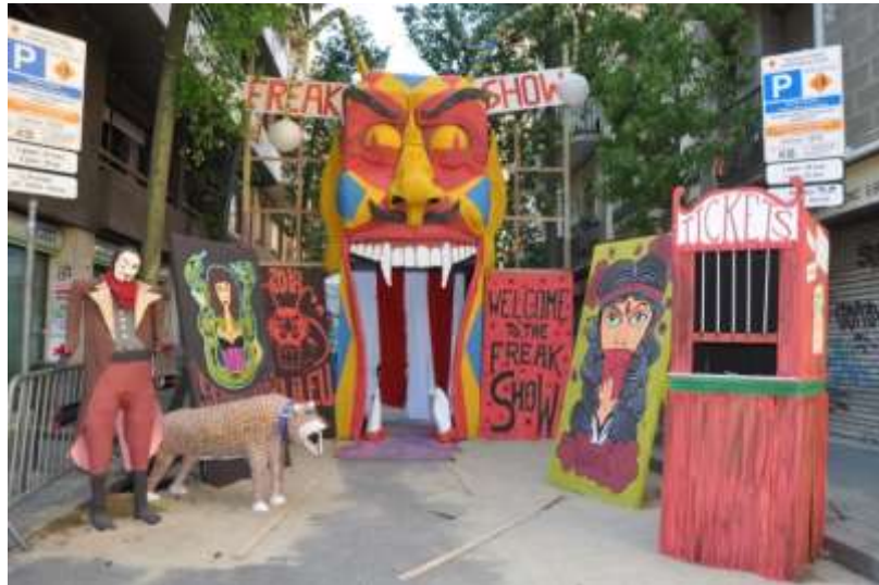
Imatges de la Festa Major de Sants de l'any passat. Ajuntament de Barcelona