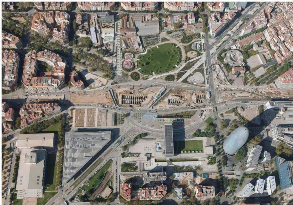
Foto Glòries 24 octubre 2019

Els treballs que s'han de realitzar consisteixen en la col·locació de 46 bigues de reforç en una longitud de 50 metres lineals del túnel ferroviari. Per fer aquests treballs és necessari treure la catenària i això obliga a la interrupció del servei que s'ha de dur a terme durant els propers dies.