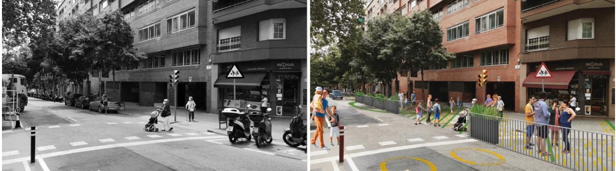
Estat actual de l'entorn de l'Escola Sagrada Família – Sardanya (esquerre) i simulació de la pacificació que s'executarà (dreta), al carrer de Sardanya.