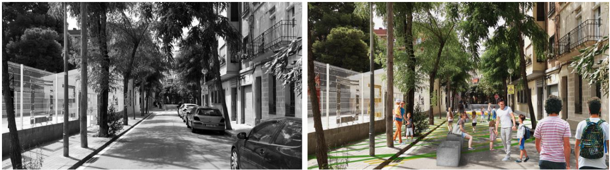
Estat actual de l'entorn de l'Escola Ferran i Clua, l'Institut Alzina i l'Escola Bressol Municipal Manigua (esquerre) i simulació de la pacificació que s'executarà (dreta), al carrer de les Acàcies.

Amb tot, les obres als 22 centres educatius d'aquest any beneficiaran 8.484 alumnes i suposaran 4.352 m 2 guanyats a l'asfalt, 5 carrers prioritzats al vianant, 37 nous espais de joc espontani i més mobiliari urbà. En concret: