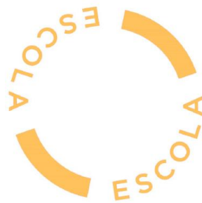
Logotip específic d'entorn escolar.

El programa Protegim les Escoles no s'aturarà el 2020. L'any vinent tindrà continuïtat en unes 50 escoles més que ja tenen el projecte enllestit i que s'aniran executant a mesura que hi hagi els recursos disponibles. Però no només això. També durant el 2021 s'actuarà de forma coordinada amb els Districtes a tots els entorns de centres educatius de la ciutat –585– per, com a mínim, senyalitzar de forma visible per als conductors que s'està a prop d'una escola perquè augmentin l'atenció i redueixin la velocitat.