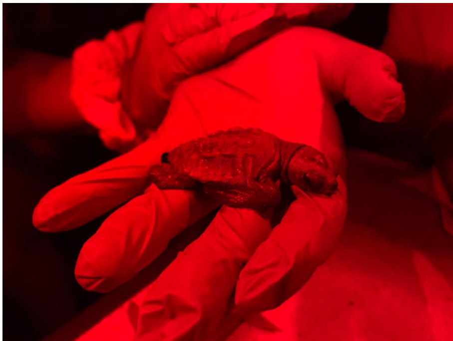
Una de les cries nascudes aquesta nit a la platja de la Mar Bella.

Les primeres 5 cries de tortuga careta ( Caretta caretta ) del niu de la platja de la Mar Bella, a la ciutat de Barcelona, han començat a néixer al llarg d'aquesta passada nit. Les tortugues solen néixer durant les hores de foscor, així que s'espera que durant les properes dues nits eclosionin la resta dels 60 ous. Es tracta del primer cop que una tortuga careta fa la posta en una platja de la ciutat de Barcelona, i també va ser el primer dels quatre nius localitzats enguany a