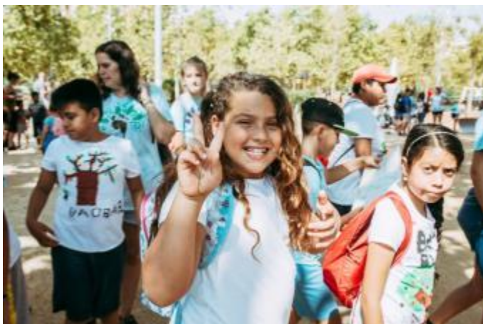
(Cloenda del programa Baobab, a l'estiu del 2019)