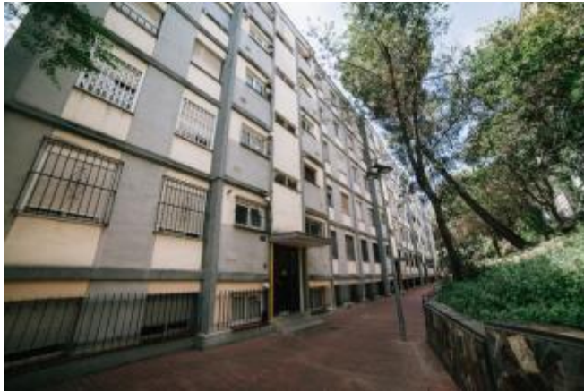
(Una de les finques incloses al programa de rehabilitació, a Ciutat Meridiana)