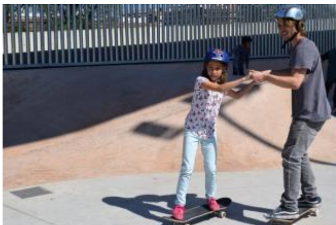
(Una nena aprèn a anar amb skate, al parc de patinatge de Baró de Viver)

transcendental amb el vincle amb els serveis i equipaments del territori, principalment el centre cívic de Baró de Viver. Durant tres tardes a la setmana es propicia la trobada al voltant del món de l'skate i altres disciplines sobre rodes per a infants i joves de Baró de Viver i Trinitat Vella. Al mateix temps, s'està propiciant el sorgiment d'oportunitats formatives i fins i tot laborals en l'àmbit del monitoratge esportiu per a aquests adolescents i joves de Baró de Viver implicats en el projecte.