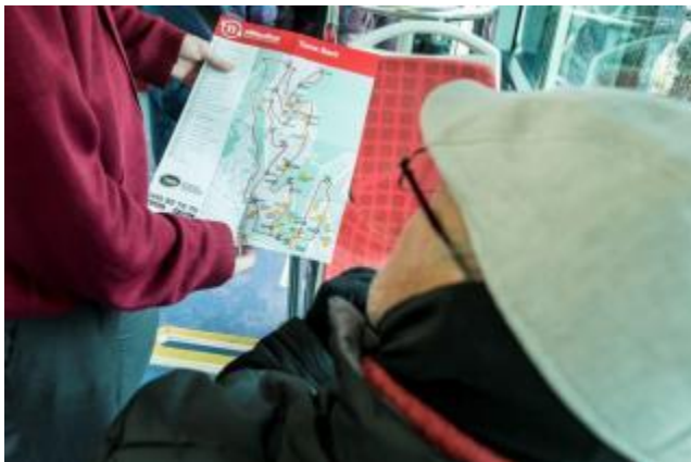
(Un passatger d'ElMeuBus, a Torre Baró)