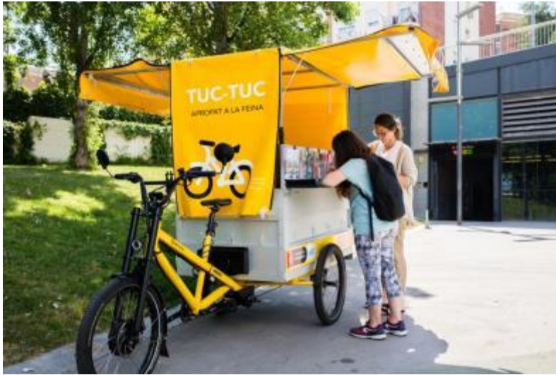
(El servei d'orientació laboral al barri de la Trinitat Nova)