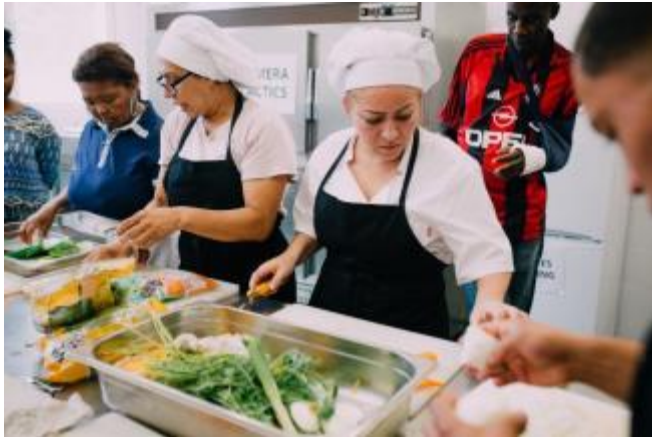
(Participants al programa per a persones en situació irregular)