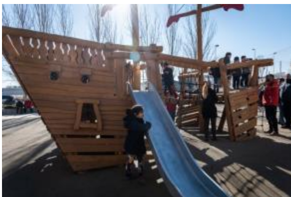
(Infants gaudeixen de la nova plaça durant la inauguració)

Aquesta actuació a comptar amb una participació activa d'infants, veïns i veïnes.