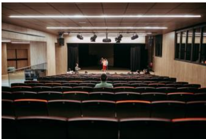
(Sala Maremar, a la Marina)