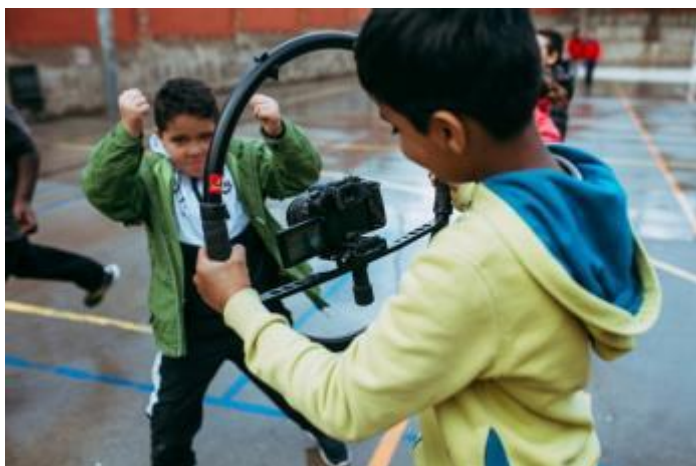
(Projecte audiovisual de l'Institut Escola Trinitat Nova)

L'Institut Escola Trinitat Nova és clau en el canvi de model educatiu del barri. Amb el Pla de Barris es construeix un nou centre educatiu que substitueix els tres anteriors, integrant un eix singular i transversal basat en les arts audiovisuals, i convertint aquesta temàtica en un eix vertebrador que entra a les assignatures curriculars. Ho fa treballant la narrativa a través dels guions, les matemàtiques a través dels diaframes, l'esperit crític a través dels visionats, el treball en equip i cooperatiu a través dels rodatges... Consta d'un plató on es fan realitat les gravacions, i està dotat del material específic audiovisual (càmeres, pantalles, equips de so, etc.). És un equipament que s'obre al barri a través de la nova biblioteca i de la nova mediateca i a través de la seva unitat de ràdio, i treballa al costat de les entitats i del veïnat.