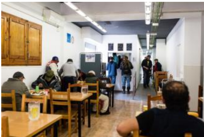
(Usuaris del Menjador Solidari Gregal)

Des del 2016 el Pla de barris acompanya aquest projecte de manera integral, des de l'adequació de les noves instal·lacions, fins el procés de reformulació del projecte i el suport a totes les persones que el conformen.