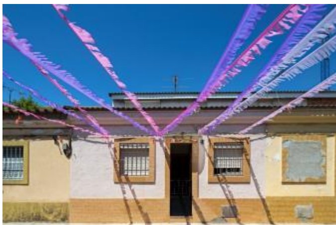
(Una casa del nucli de Cases Barates del Bon Pastor)

i noves comunitats de veïns. L'acompanyament dels veïns afectats (sovint gent gran) facilita el trànsit emocional que el trasllat comporta i apodera les noves comunitats de veïns i veïnes per establir un marc comú de convivència.