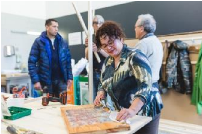
(Una participant al taller de Bricolatge de les Roquetes)

Menys. L'objectiu, ara, és donar eines d'economia domèstica a col·lectius vulnerables, generar un grup de suport mutu i autoajuda per poder reduir el malestar emocional, vincular els participants a la xarxa comunitària del barri i explorar la possibilitat de generar una nova xarxa de serveis al barri. I així neix, a finals del 2018, el taller Menys amb Més Bricolatge, un projecte, en col·laboració amb les diverses entitats del barri, que vol acompanyar i ser un suport per a totes les persones en risc d'exclusió, sigui en quin sigui el motiu.