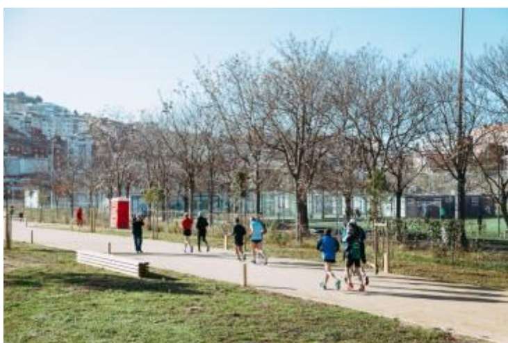
(Cursa esportiva durant el dia de la inauguració)

L'actuació, que va tenir un procés participatiu durant el primer trimestre del 2018 per decidir els usos i activitats del nou espai, consisteix a condicionar l'espai de la Campa perquè sigui un espai de promoció de la salut i l'esport.