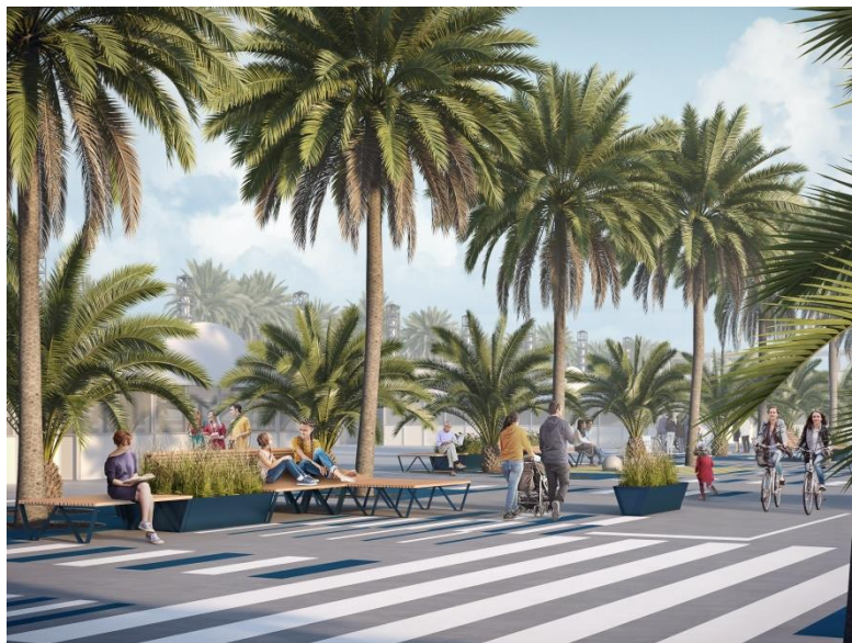
Simulació de la reforma provisional de l'espai públic al Port Olímpic.

La recuperació dels locals és una de les peces imprescindibles per poder iniciar la transició cap al nou model de Port, ja que permetrà iniciar la construcció d'un nou accés que connectarà l'Avinguda Litoral amb la cota inferior del Moll de Mestral. D'aquesta manera es garantirà la permeabilitat de l'espai, es millorarà l'accessibilitat i s'eliminaran barreres i desnivells que generaran una continuïtat entre el Port i la ciutat.