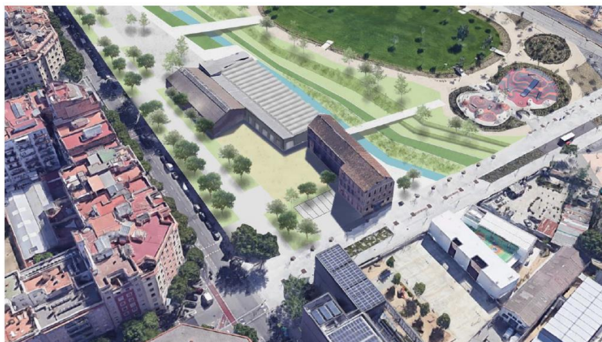
Proposta d'ubicació del CEIP Gaia, a l'antiga fàbrica de paraigües.

Quant als equipaments, dins l'àmbit hi ha l'Escola Encants i l'Escola Bressol Leonor Serrano, que mantenen la seva ubicació. I com a novetat, a partir de les aportacions rebudes en el procés d'informació pública s'ha decidit incorporar el CEIP Gaia a l'antiga fàbrica de paraigües del carrer del Dos de Maig. Aquest centre ara està ubicat provisionalment als antics mòduls prefabricats de l'Escola Encants, i amb el Consorci d'Educació de Barcelona s'ha avaluat que el programa funcional encaixa bé a l'antiga fàbrica i hi ha la superfície de pati necessària. A més, es mantindran els elements constructius i tradicionals fabrils d'interès de l'edifici.