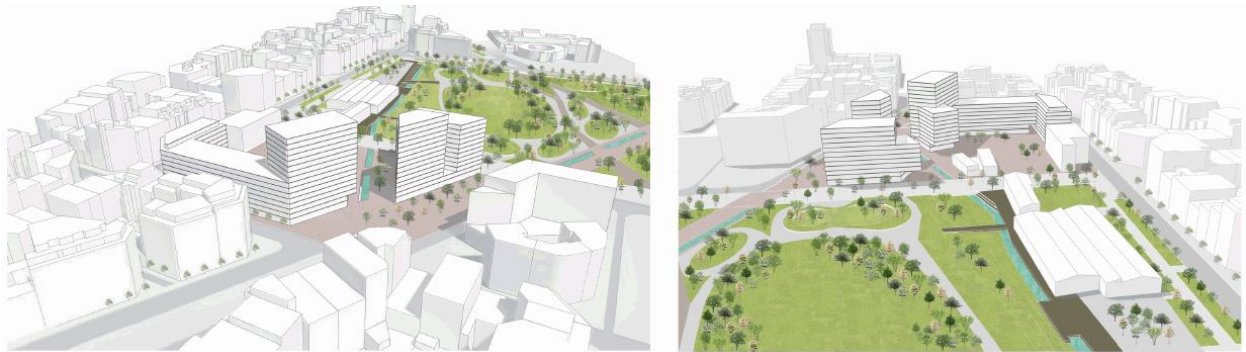
Vista sud (esquerra) i vista nord (dreta) de l'àmbit.

El sostre edificable serà de 50.000 m 2 , dels quals 45.000 es destinaran a habitatge i 5.000, a comerços i les activitats econòmiques. Pel que fa a la volumetria, s'ha millorat substancialment la proposta de l'aprovació inicial, ja que s'ha allunyat els edificis més alts dels equipaments educatius previstos per generar un espai lliure de més qualitat i un millor assolament dels centres.