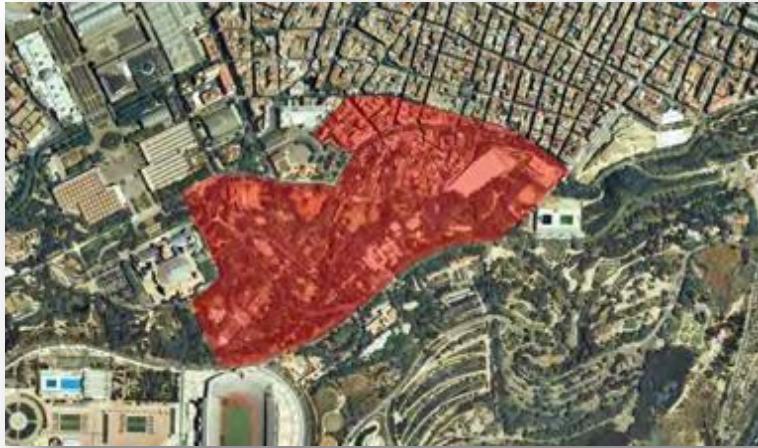
Delimitació de la zona estudiada sobre el terreny (H.A. Orengo). Pàg. 53