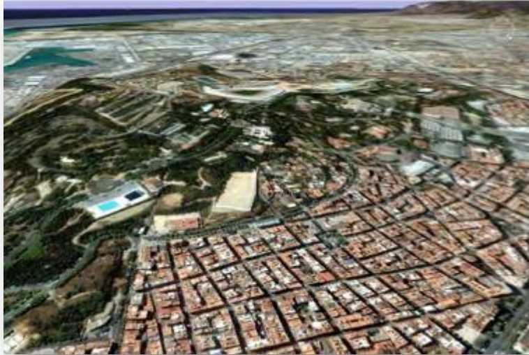
Imatge 3D del vessant nord de Montjuïc (UDG ICAC). Pàg. 23