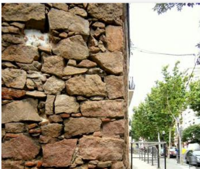
Passeig de l'Exposició davant del carrer de Radas del Poble-sec. Pàg. 29