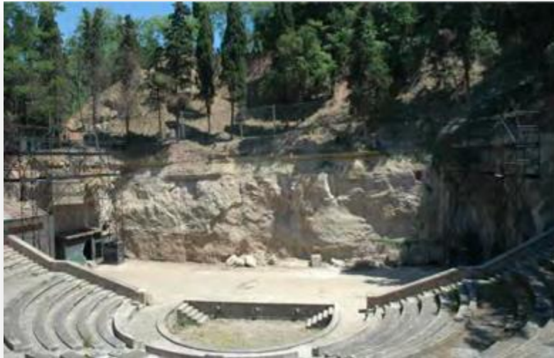
Vista del front de la pedrera Machinet al Teatre Grec. Pàg. 104