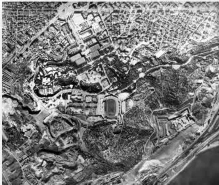
Fotografia aèria de la muntanya de Montjuïc de l'any 1947 en què s'aprecien la intensa ocupació urbana i agrícola de la muntanya i els fronts d'extracció de la pedra de Montjuïc. Pàg. 55