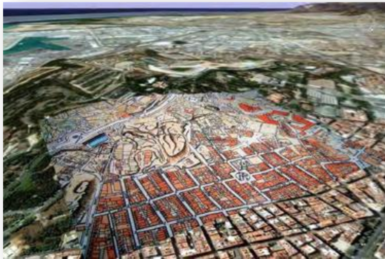
Detall del mapa de V. Martorell del 1929 sobre la imatge anterior. Pàg. 2