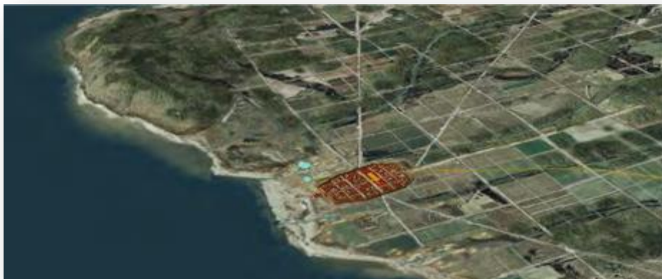
Reconstrucció fotogràfica de Montjuïc i el seu entorn als segles I-II dC. En groc veiem les traces documentades per l'estudi arqueomorfològic (UDG ICAC). Pàg. 154

Per a més informació: http://ajuntament.barcelona.cat/barcelonallibres/ Laura Santaflorentina / Tel. 699061244 / E-mail: laurasantaflorentina@gmail.com