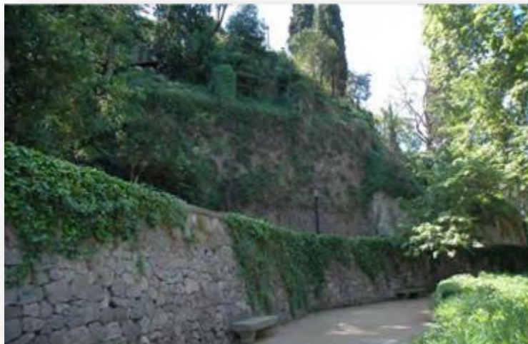
Vista del front d'exploració de pedrera als jardins Laribal. Pàg. 105