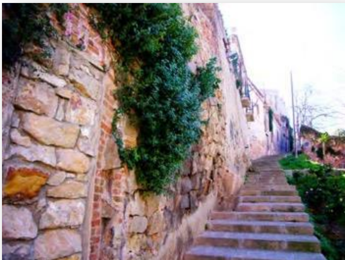
Camí de la Creu dels Molers. Pàg. 25