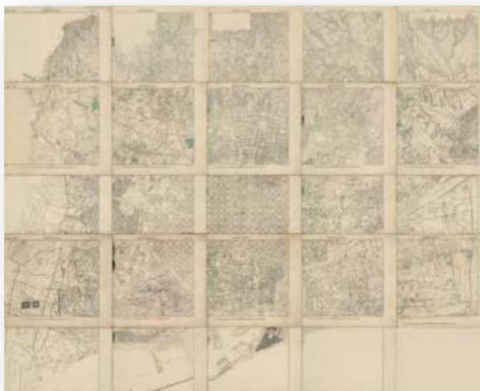
Base cartogràfica de V. Martorell dels anys trenta georeferenciada (H.A. Orenge). Pàg. 33