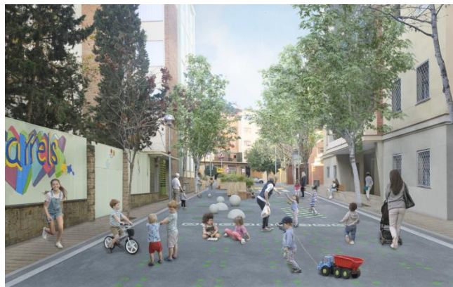
Recreació de l'entorn de l'Escola Arrels, amb la pacificació del carrer de Can Ros (Sant Andreu).