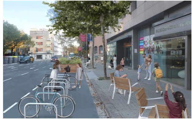
Dos futurs entorns escolars amb ampliació de vorera: a l'esquerra, l'Escola La Sedeta (Gràcia), i a la dreta, l'Escola Pare Manyanet (les Corts).