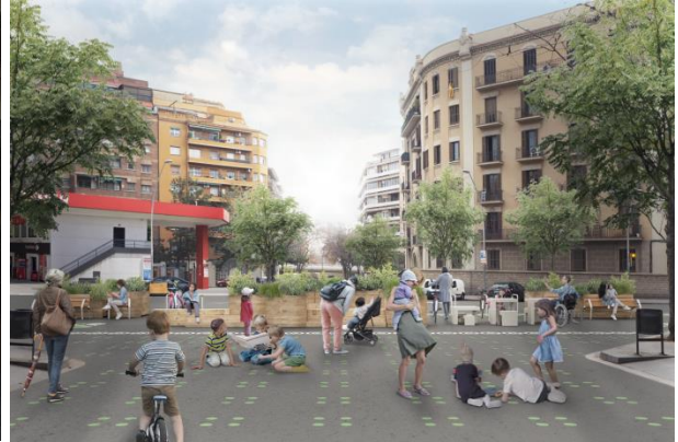
A l'esquerra, recreació de l'entorn de La Salle Horta, amb la pacificació del carrer Letamendi (Horta-Guinardó); a la dreta, entorn de l'Escola Octavio Paz, amb la pacificació del carrer de Biscaia (Sant Andreu).