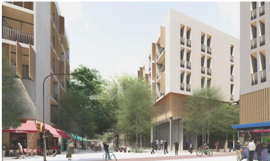
Simulació d'uns dels edificis d'habitatges previstos.

La nova distribució permet situar una zona residencial amb fins a 500 habitatges públics nous que, a més, permetran guanyar locals comercials públics. D'aquesta manera, es generarà ciutat i s'augmentarà el parc públic d'habitatge assequible en una zona on hi ha molt pocs solars lliures on poder construir.