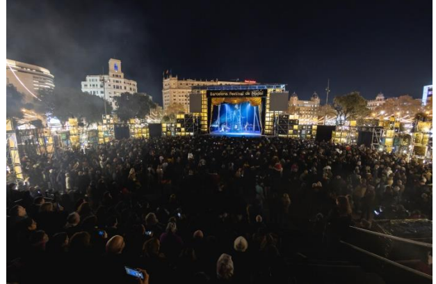
La torre de Nadal

Més de 2.000 persones han omplert cada nit les localitats per veure aquest gran espectacle d'òpera i circ. Creat per Lluís Danés i produït pel Gran Teatre del Liceu i l'Ajuntament de Barcelona ha portat al festival un viatge musical que reclamava la utopia com a eina de transformació del món amb el guiatge de Giacomo Puccini. Una història de circ amb equilibris, corda, suspensió capil·lar, trapezi i dansa amb sis intèrprets de circ, vuit músics i quatre cantants.