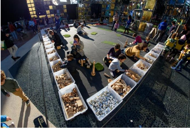
Nadal en família