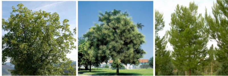
Arbrat de la Canòpia