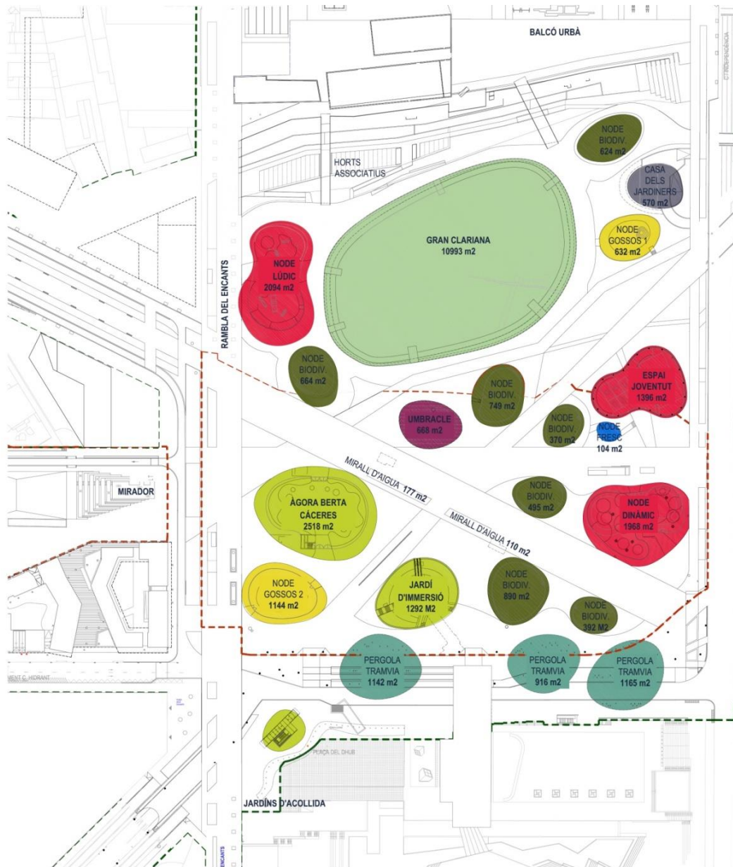
Imatges dels diferents nodes del parc

Els nodes de biodiversitat i els jardins de pluja contribueixen a una gestió hídrica eficient. Amb el projecte del parc “Canòpia Urbana” es pretén restaurar, en la mesura del possible, els cicles naturals dins del entorn urbà i amb aquesta finalitat s’ha dissenyat l’estratègia de vegetació i de gestió del cicle de l’aigua. Així, l’aigua de pluja dels paviments es dirigeix als nodes i jardins de pluja, on s’infiltra al terreny i contribueix a reomplir l’aqüífer. La densitat vegetal dels nodes i el nou sòl fèrtil contribueixen a la regulació climàtica, aportant frescor i confort a l’estiu.