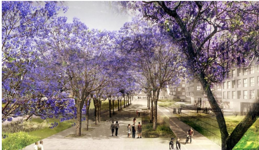
Imatge futura de la Rambla dels Encants