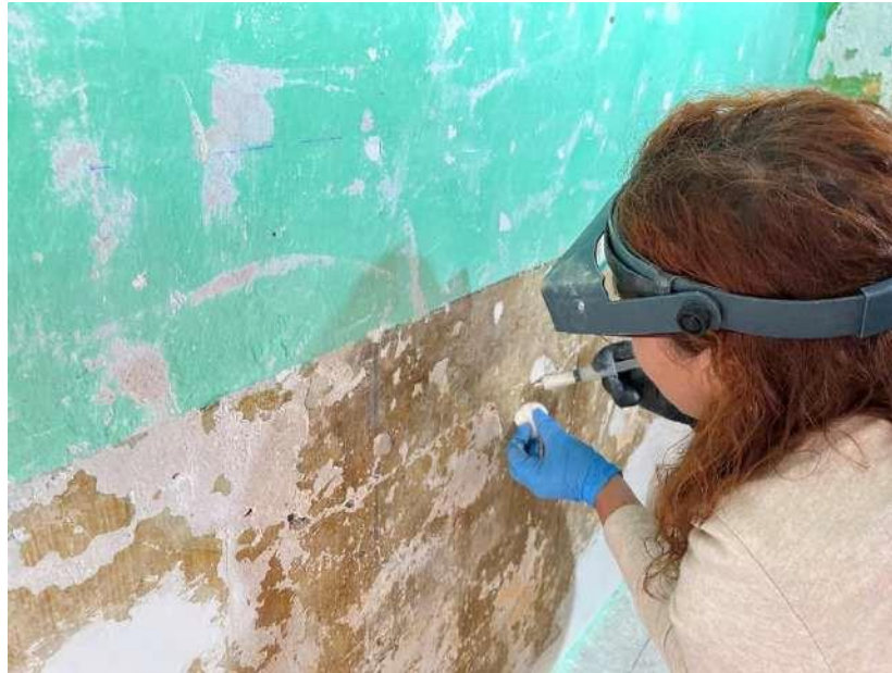
Feines del treball de restauració.