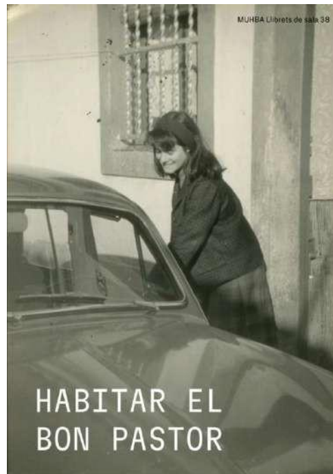
Portada llibret de sala de l'exposició

La restitució patrimonial i exposició mostra els períodes claus en la trajectòria d'un barri que és un magnífic exponent de l'evolució de la ciutat des del punt de vista de l'habitatge i la cohesió social dels barris al llarg del segle XX. El treball de reconstrucció de quatre cases barates reflecteix la trajectòria del Bon Pastor entre 1929 i 2010, amb un breu epíleg fins al 2022.