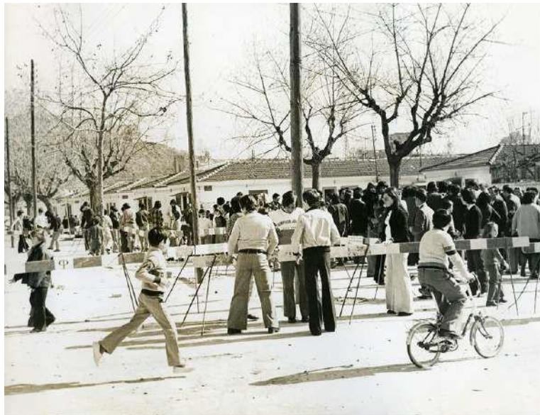
Manifestació per demanar ambulatori. Bon Pastor, 1975.

2. Un testimoni cabdal de l'habitatge popular. Els polígons de cases barates acabats el 1929 van ser el primer model d'habitatge social de Barcelona. Dos es van situar vora el Besòs, en terrenys aleshores de Santa Coloma de Gramenet: Baró de Viver i Milans del Bosch, l'actual Bon Pastor. Un factor que ha fet d'aquest darrer un lloc singular respecte d'altres barris de classe treballadora ha estat el seu caràcter de banc de proves de propostes d'habitatge diverses, no sempre realitzades, al llarg del segle XX i fins a temps recents. MUHBA Bon Pastor conté les seccions del museu dedicades a l'habitatge popular: 34 (Allotjar les majories) i 35 (Les Cases Barates.)