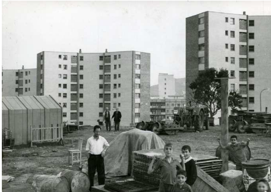
Barri de La Guineueta, 1966, autor desconegut. Arxiu fotogràfic de Barcelona