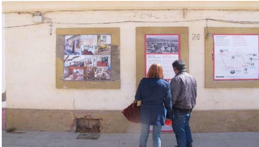
Plafons informatius a MUHBA Bon Pastor. MUHBA

4. La creació d'una col·lecció. La constitució de la col·lecció de béns mobles ha estat possible gràcies a la col·laboració ciutadana. El treball compartit entre les persones del barri i l'equip format pel MUHBA ha permès compilar un arxiu d'escrits, fotografies i filmacions, a més d'aplegar mobles i objectes de tota mena, que, sistematitzats com a estoc de base per a la Col·lecció d'Història Contemporània de Barcelona, han d'estar a disposició de la ciutadania com una part de l'arxiu del projecte. L'exposició pública que es va fer dels avenços en la col·lecció, amb una instal·lació a la manera escenogràfica del film Dogville el 30 de març de 2019, a la plaça de Vilabesòs, va donar impuls social i institucional al projecte.