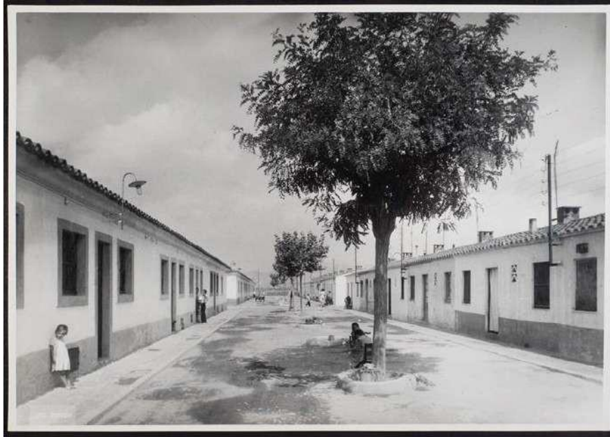
Brangulí, sense data. Bon Pastor. Font: IMHAB

LES CASES BARATES DEL DISTRICTE DE SANT ANDREU MUHBA BON PASTOR