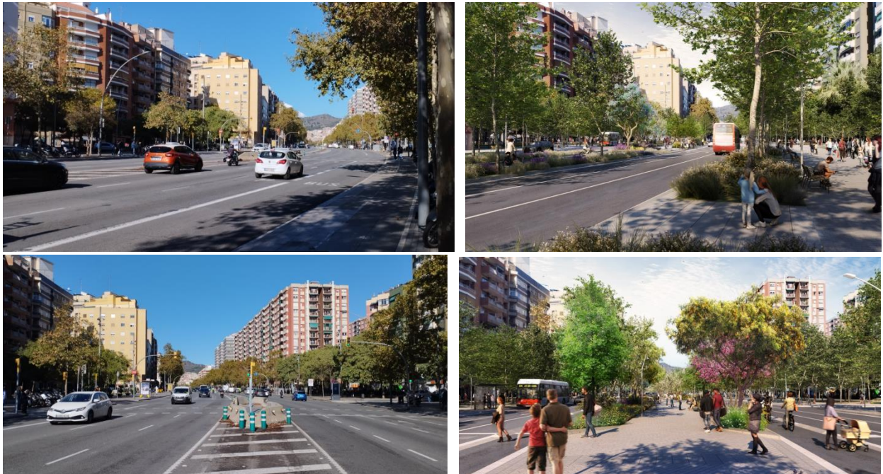
Recreacions virtuals de l'abans i el després del nou tram de la Meridiana Felip II – Fabra i Puig i de l'espai central de l'eix de transversalitat de la Sagrera.

L'eix de transversalitat de la Sagrera abastarà l'àmbit dels carrers del Cardenal Tedeschini, Pegàs, Antilles i Olesa, i serà molt similar al que es crearà a Navas. Hi haurà un espai central ampli per als vianants i el carril bici se situarà a banda a banda i serà unidireccional. A més, es milloraran els jardins de Pilar López de Ayala, on els jocs infantils passaran a ser accessibles, i també l'eixamplament de la Meridiana entre els carrers d'Antilles i Pegàs, amb més vegetació i espais verds de qualitat a tots dos espais. En aquest àmbit es faran dos passos de vianants nous, i en total n'hi passaran a haver quatre.