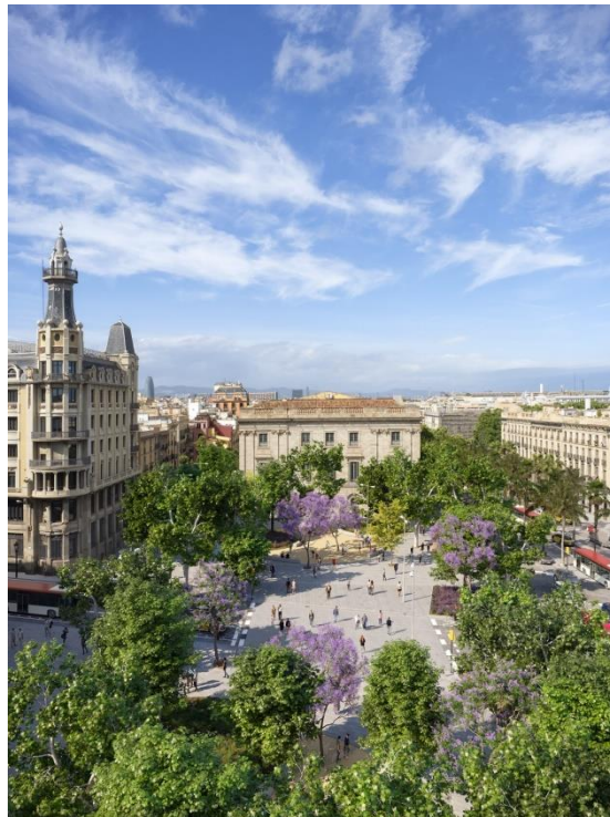
Render de la nova connexió entre la plaça d'Idrissa Diallo i la de Correus

El projecte del nou tram preveu reubicar i incrementar l'amplada dels passos de vianants i renovar l'enllumenat en façanes. Aquest tram incorpora dos espais singulars, la Plaça de l'Àngel i el conjunt que formen la plaça Idrissa Diallo i la de Correus. La primera es reurbanitzarà deixant-la tota al mateix nivell, incrementant l'arbrat, incorporant nou enllumenat i recol.locant i ampliant els passos de vianants. Pel que fa al segon espai, es connectaran les places d'Idrissa Diallo i de Correus amb un pas de vianants més ample i central; també s'incorporarà un nou pas de vianants que connectarà amb la Barceloneta a través del carrer Llauder; es pacificaran els carrers Consolat de Mar, Fusteria i Àngel Baixeras; s'incorporarà nou enllumenat i s'augmentarà la vegetació amb més arbustiu i arbrat, alhora que es generaran nous espais d'estada.