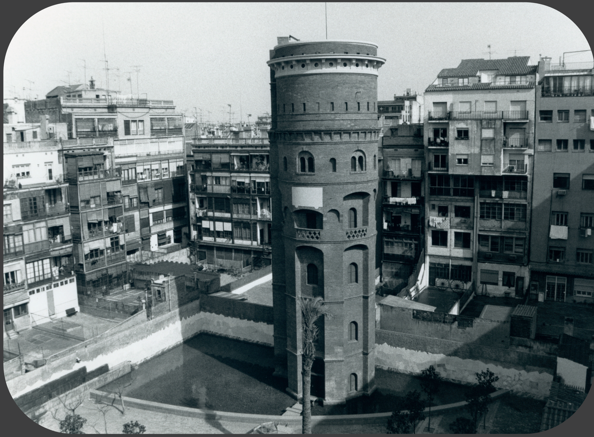
Jardins de la Torre de les Aigües (1988).

En dissenyar la urbanització de l'Eixample, Ildefons Cerdà va preveure una quadrícula amb amplis espais oberts. El seu pla assignava un paper clau als parcs i jardins interiors, que ell anomenava mansanes , però malauradament els interessos dels propietaris del sòl i l'especulació posterior van acabar per desvirtuar el pla.