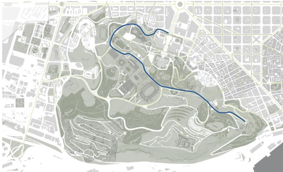
Carril bici previst entre la plaça d'Espanya i l'avinguda Miramar

L'any que ve s'instal·laran 8 noves estacions de Bicing a l'entorn de l'estadi i està previst que el FC Barcelona posi a disposició dels espectadors i espectadores una consigna per a patinets elèctrics i bicicletes en aquest mateix àmbit.