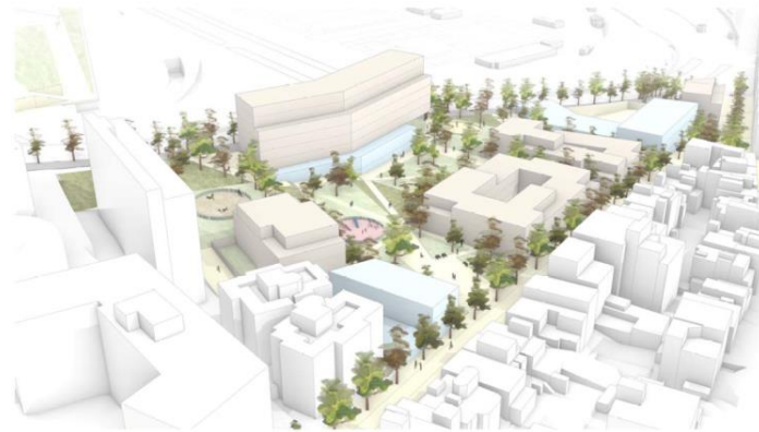
Simulació del conjunt del nou parc des del carrer de Segur.