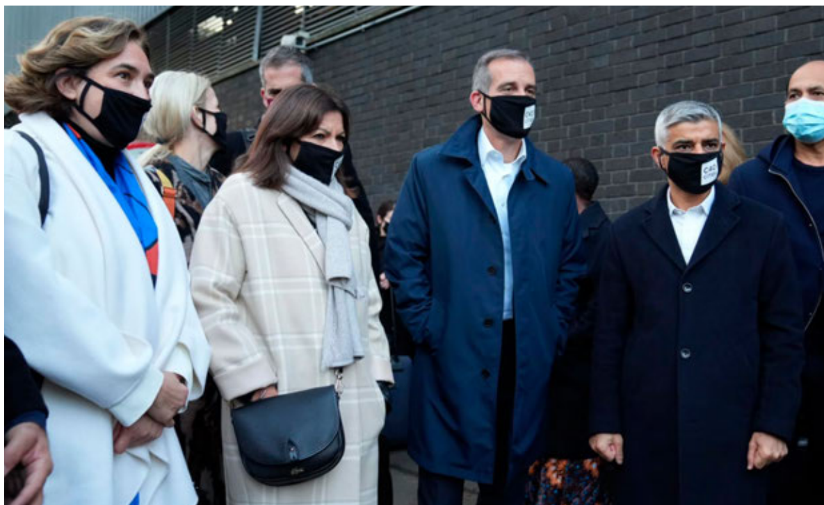
La alcaldesa Ada Colau con la alcaldesa de París, Anne Hidalgo; el alcalde de Los Ángeles, Eric Garcetti, y el alcalde de Londres, Sadiq Khan, durante la Cumbre Mundial del Clima COP26 celebrada en Glasgow en noviembre de 2021 (foto: Ayuntamiento de Barcelona).

Unos meses antes de esta cumbre, la alcaldesa de Barcelona encabezó, junto al alcalde de Londres, un encuentro telemático entre varios alcaldes y alcaldesas de C40, la Agencia Internacional de la Energía (IAE) y líderes sindicales europeos con el objetivo de abordar el crecimiento de los precios de los combustibles fósiles y el impacto de la invasión de Ucrania, donde se presentó un plan de acción para combatir la pobreza energética y evidenciar la necesidad de reducir drásticamente la dependencia del gas potenciando las energías renovables.