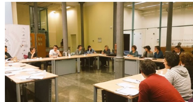
Imatge 1: sessió de seminari permanent de 2017

El primer va comptar amb un total de trenta-quatre entitats i va permetre aprofundir en aspectes teòrics i pràctics en relació amb el concepte EpJG.