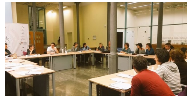
Imagen 1. Sesión de seminario permanente en 2017

El primero contó con un total de 34 entidades y permitió profundizar en aspectos teórico-prácticos en relación con el concepto de la EpJG.