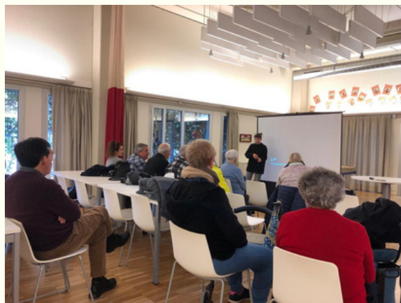
Imatge de la formació de compostatge