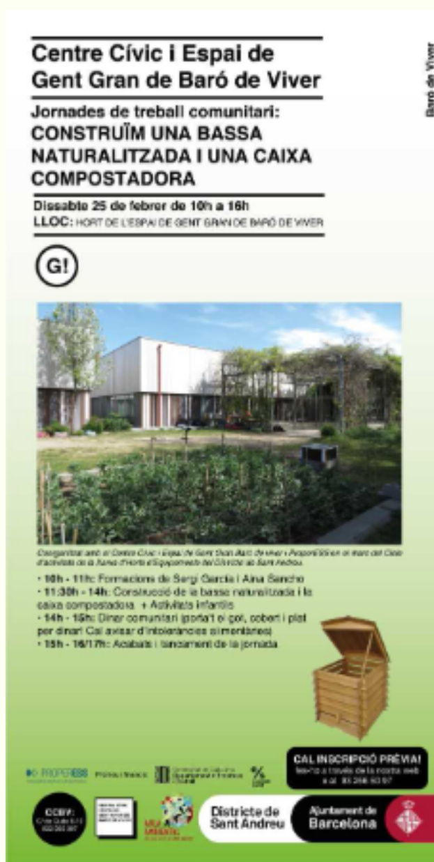
Imatge cartell jornades de treball