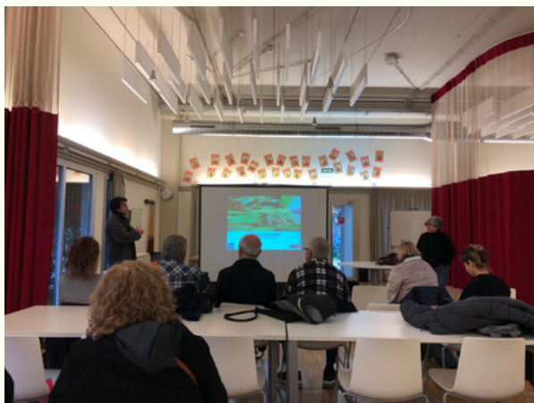
Imatge de la formació de la bassa