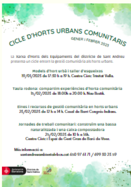
Imatge cartell del cicle

És per aquest motiu, que a l'hivern del 2023, l'Aula programa un cicle entorn de la gestió comunitària que culmina el 25 de febrer, amb unes jornades de treball comunitari al Centre Cívic i Espai de Gent Gran Baró de Viver, on es fan les formacions i les construccions de la bassa naturalitzada i una caixa compostadora, per l'espai d'hort. S'acompanyen les jornades de dinamitzacions infantils i un dinar popular, amb l'objectiu de fomentar l'esperit comunitari, els coneixements i les relacions dels hortolans i hortolanes del districte.