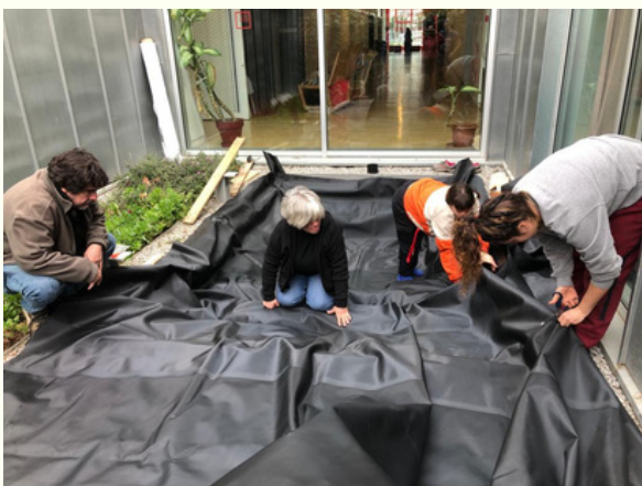
Pas 3: posar la Làmina EPDM