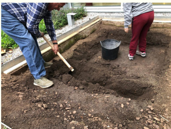
Pas 1: Fer el forat a diferents nivells, perquè hi visquin diferents tipus de plantes aquàtiques.

L'orgànicament els participants van anar canviant i ajudant en totes dues construccions.