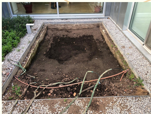
Imatge de la bassa quan es comença a fer el forat

El dissabte 25, van participar unes 50 persones en la construcció de la bassa i la caixa compostadora al Centre Cívic i Espai de Gent Gran de Baró de Viver.