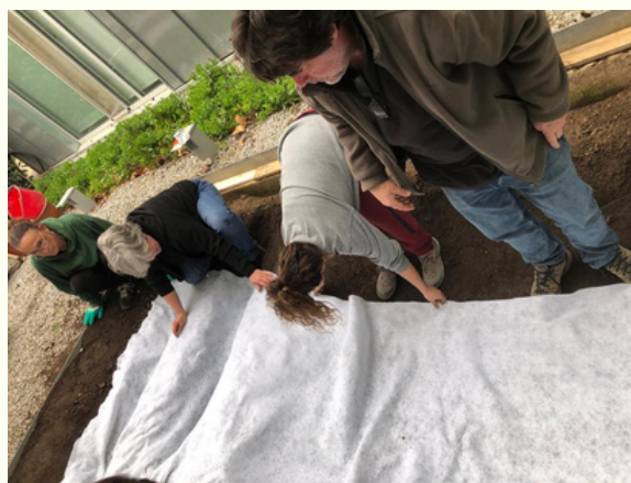
Pas 2: posar la malla geotèxtil, per protegir la làmina EPDM.