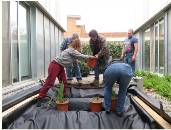
Pas 4: posar les plantes aquàtiques i omplir la bassa amb aigua