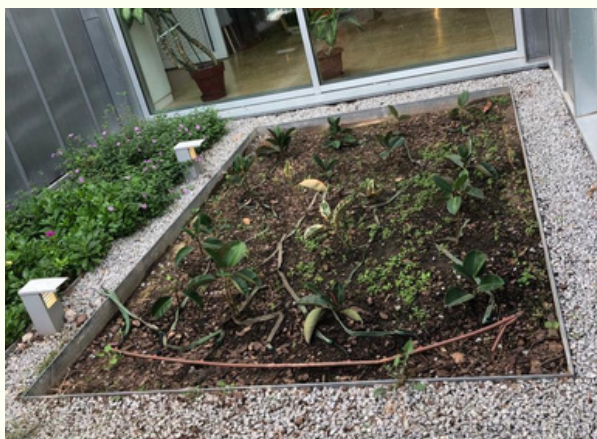
Imatge de la bassa abans de la construcció

El 25 de febrer del 2023, es duu a terme la formació i construcció de la bassa naturalitzada del Centre Cívic i Espai de Gent Gran Baró de Viver.