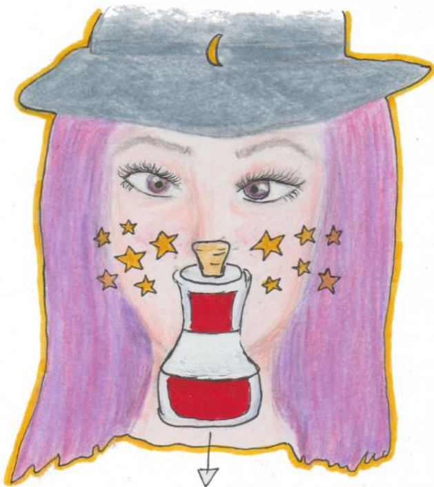
Poción de la conciencia