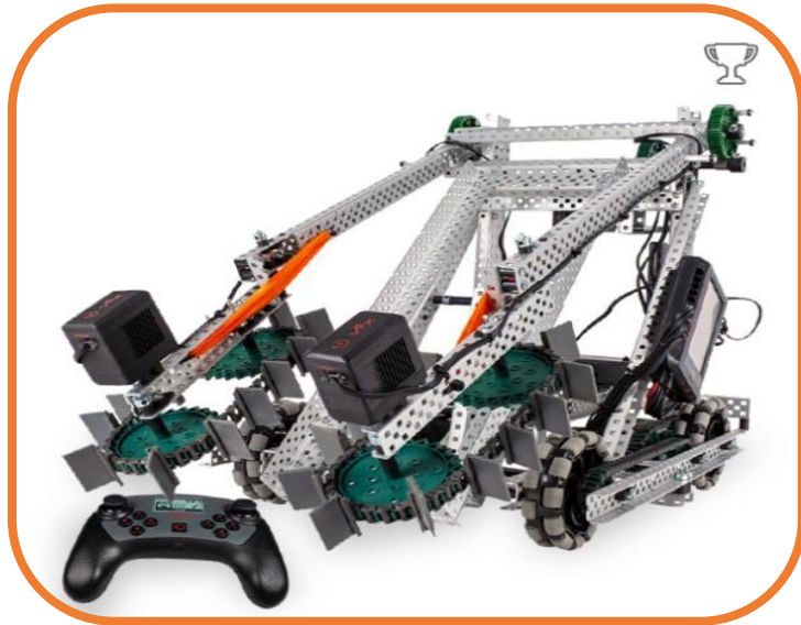
Super Kit EDR-VR5

Categoria EDR - VDR, la categoria màxima abans de les universitàries