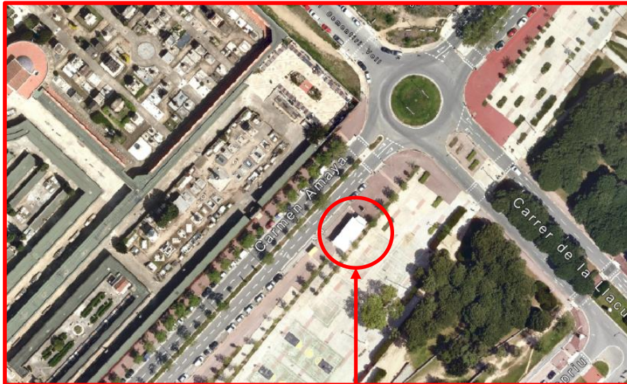
Punt Verd de Barri de Poblenou Carrer Carmen Amaya, 10