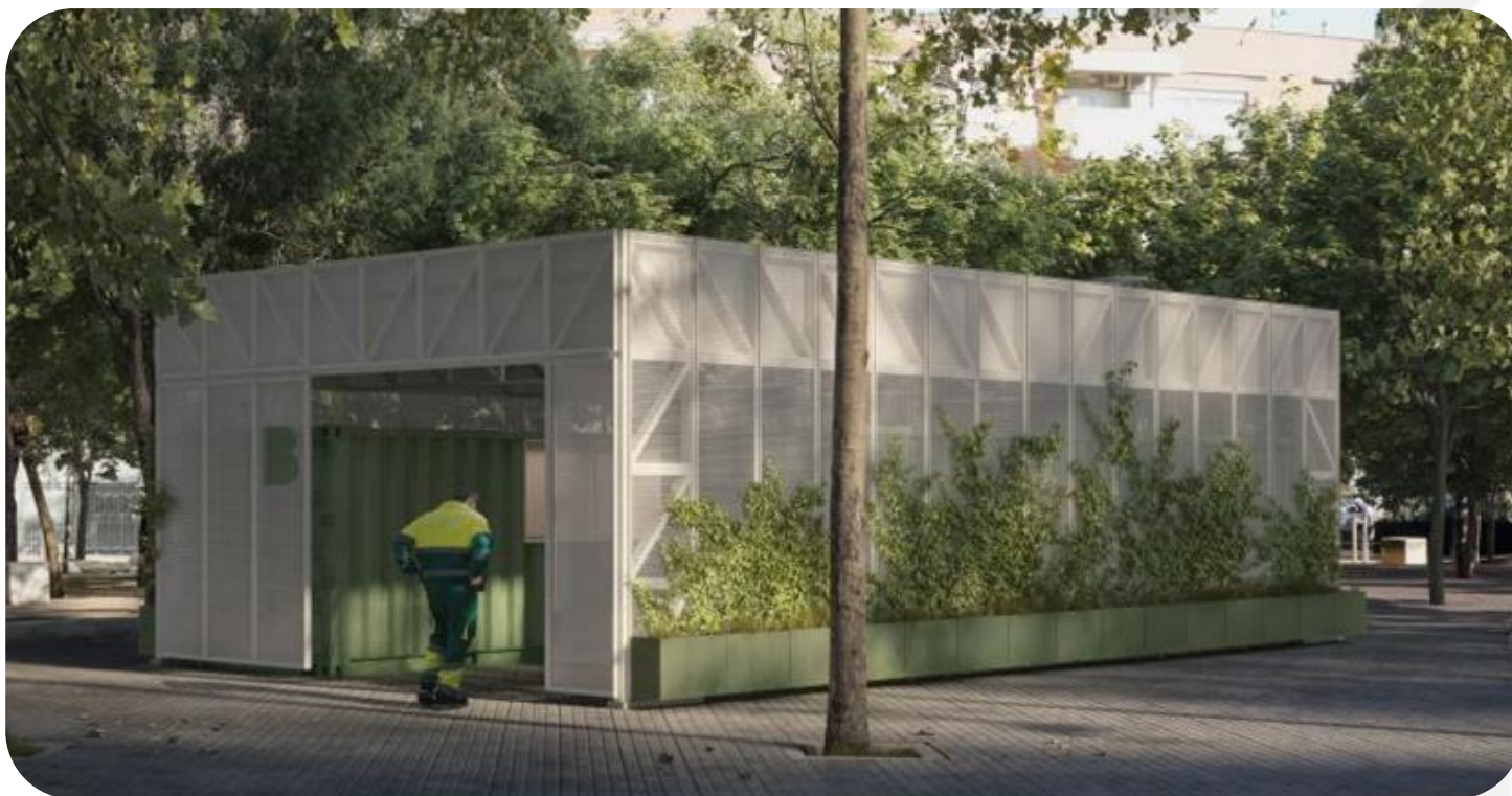
Simulació del projecte “RE- Punt” el guanyador del concurs

Es planteja un disseny fet íntegrament amb elements reciclats (contenidors de càrrega) i amb molt baixa empremta ecològica , mantenint els criteris d'autosostenibilitat.