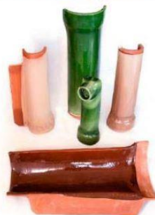
Reconstrucció de ràfec de coberta de 3 maons ceràmics, canal de ceràmica i baixants ceràmics originals