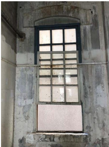
Reproduir finestres de fusta tipus "guillotina"