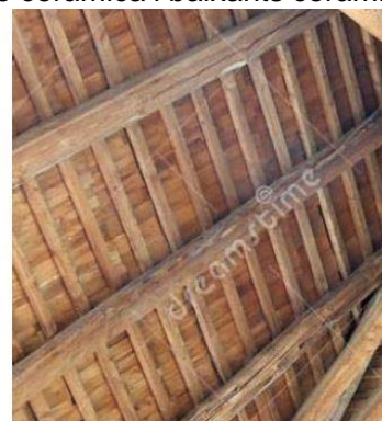
Restauració d'estructura de fusta original i nova coberta complint "CTE"