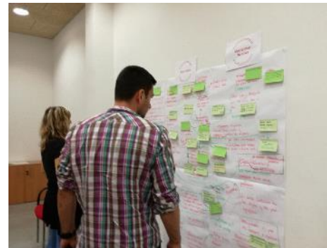
Sessió tècnics/ques 26 de maig