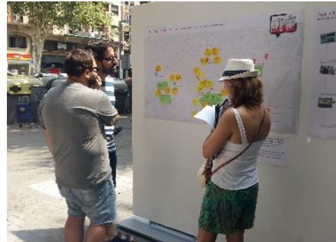
Dinamització al carrer 15 de juliol