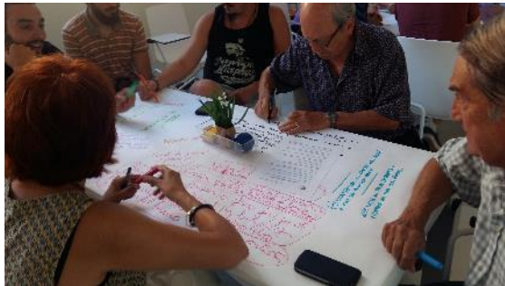
Sessió de debat amb la ciutadania 20 de juny