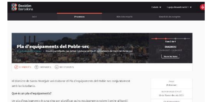
Aportacions web decidim