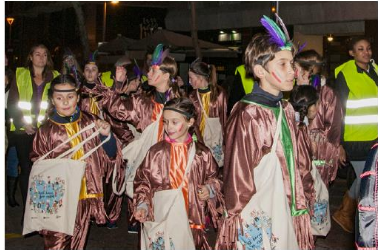
Fotos d'arxiu, cavalcades anteriors