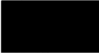
Coordinadora Tècnica de la Gerència Mobilitat i Infraestructures - Ecologia Urbana