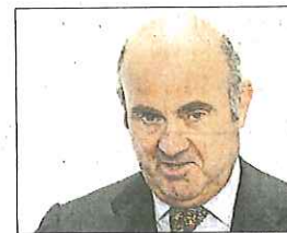
Luis de Guindos