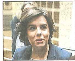
Soraya Sáenz de Santamaría

Entre els documents del sumari fets públics aquesta setmana consten diverses notes sense fir- ma que es refereixen a fons dipos- itats a Andorra per la família Pu- jol o també vinculats a CDC. En la causa figura un reconeixement notarial de què Villarejo afirma que és autor. S'hi denuncien pressions policials per obtenir dades sobre la Banca Privada d'Andorra i l'Andbank, però que el Centre Nacional d'Intel·ligèn- cia (CNI) va intervenir perquè no s'arribés a un compte anomenat Soleado, que podria estar relacio- nat amb altes personalitats, se su- posa que el rei emèrit. Fins i tot es diu que la Policia va parar algu- nes investigacions en aquesta matèria i esmenta com a testate- ros persones molt disperses, algu- nes sense relació amb CDC. Du- rant un dinar que el mateix José Manuel Villarejo gravava, un dels participants assegura que la in- tervenció de BPA ha estat "un llad- ronici" perquè era un banc que estava sanejat. De fet, l'entitat va ser intervinguda per blanqueig de capitals, no per la seva situació econòmica.