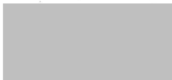
ELSA ARTADI I VILA

Que es tingui per presentat aquest escrit i es donin per formulades les nostres al·legacions a l'expedient d'aprovació provisional de l'ordenança fiscal 3.18 Taxes pel servei de recollida de residus municipals generats en els domicilis particulars per a 2020 i exercicis successius.