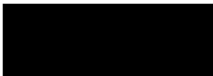
Isabel Travesset Clavaux

La cap de l'Àrea del Registre de Protecció de Dades