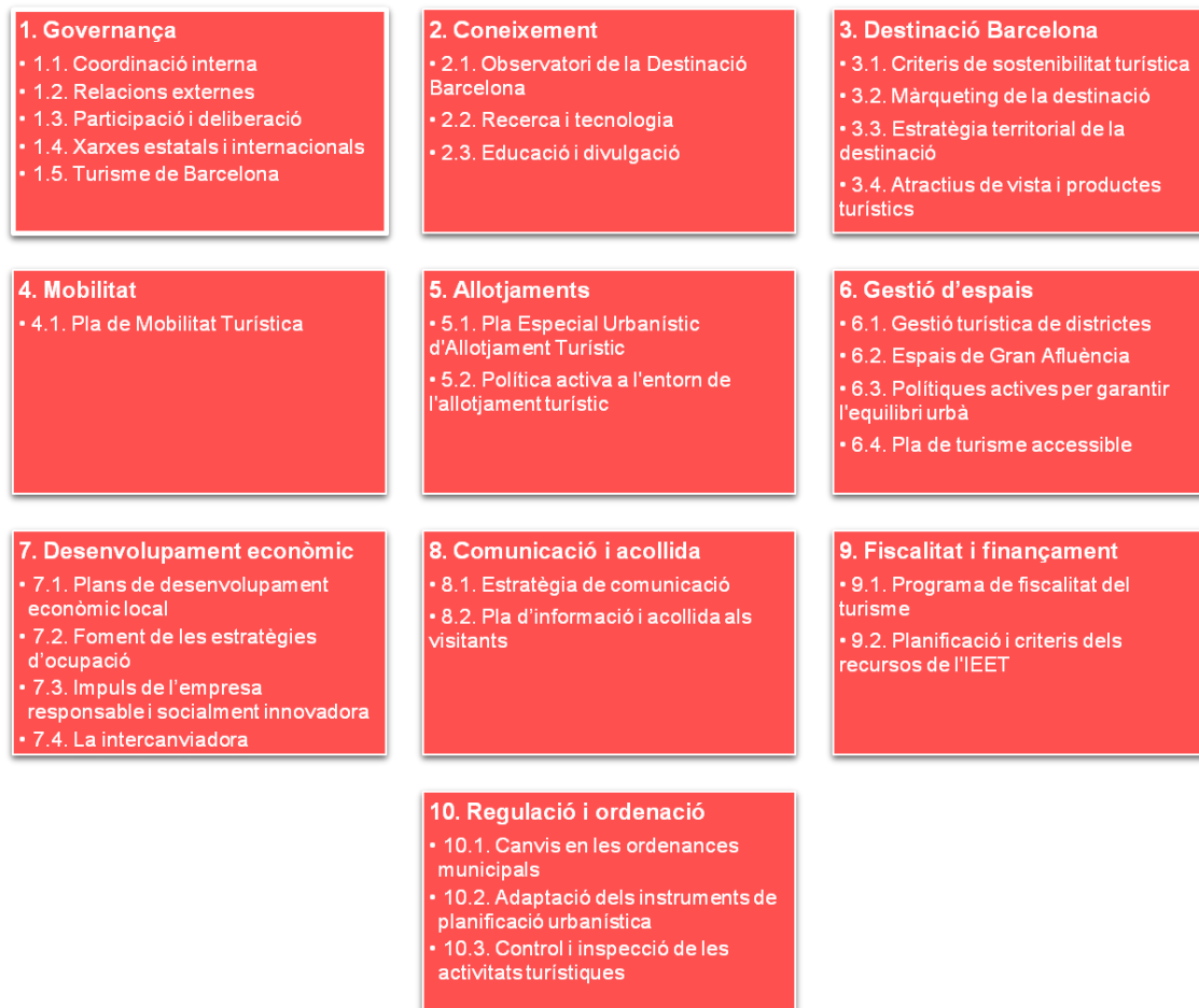
Imatge 3: Estructura dels programes

Els 10 programes i les seves línies d'actuació s'estructuren de la següent manera: