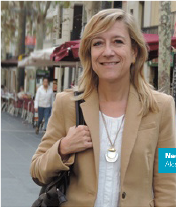
Neus Lloveras i Massana

Alcaldessa de l'Ajuntament de Vilanova i la Geltrú