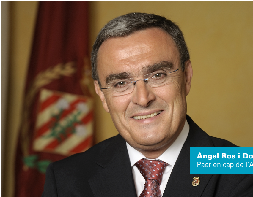
Àngel Ros i Domingo Paer en cap de l'Ajuntament de Lleida

Un model de gestió de les organitzacions i de les empreses basat en criteris responsables en els àmbits econòmic, social i ambiental contribueix a construir una societat millor i més justa. Per avançar en aquest sentit, l'Ajuntament de Lleida compta amb el Pla Municipal de Responsabilitat Social (RS) , amb l'objectiu de guiar la implantació de mesures socialment responsables en tots els sectors que han d'estar implicats en aquest model, des de la mateixa Paeria i fins al món empresarial, passant pels sindicats, les entitats del tercer sector i el