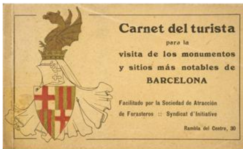
Carnet del turista para la visita de los monumentos, y sitios más notables de Barcelona / facilitado por la Sociedad de Atracción de Forasteros, Sindicat d'Initiative.— Barcelona : la Sociedad, [191-]. -- 20 p. : il. fot ; 10 x 16.