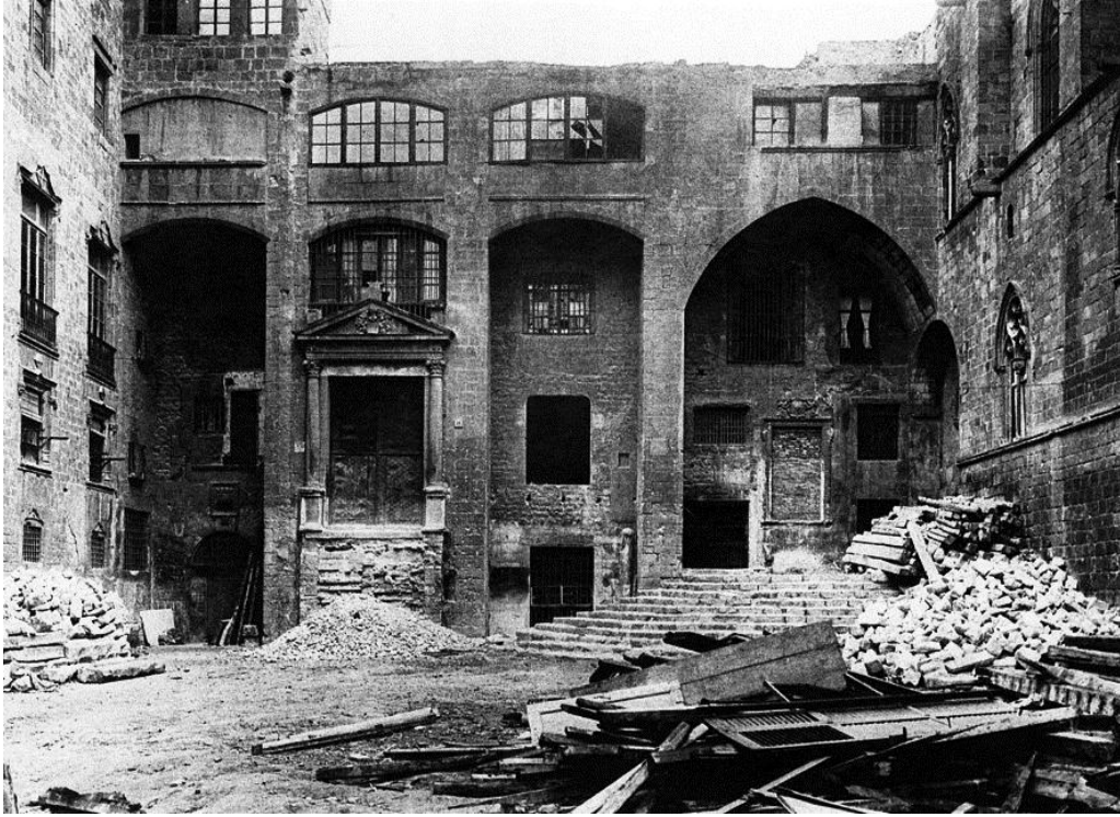
Plaça del Rei. 1936