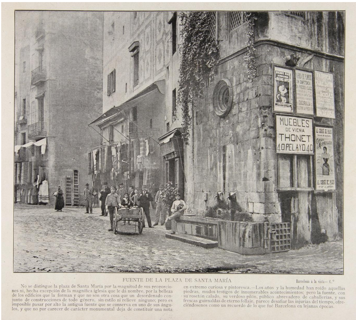
FUENTE DE LA PLAZA DE SANTA MARÍA

teatres, passejant o acudint al recent inaugurat parc d'atraccions del Tibidabo. Esbargiment, divertiment, entreteniments que ens acosten al consumisme i al desenvolupament del turisme a partir de la primera dècada del segle XX, amb alguns canvis de paràmetres en els gustos estètics, ja dins de l'esperit del noucentisme. El mapa monumental de la Sociedad de Atracción de Forasteros situa les icones dels espais de l'oci escollits per a la visita turística.