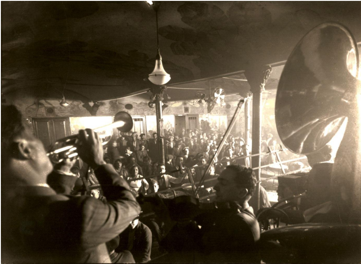
Interior de La Criolla -Cid nº 12- en 1930.