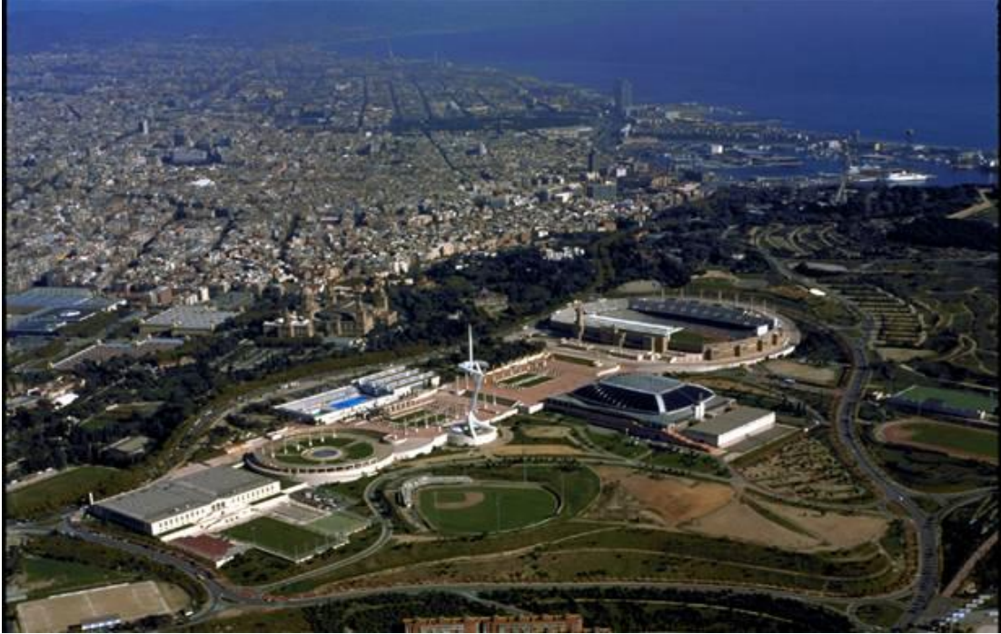
Anella olímpica de Montjuïc

La presentació que es realitzarà el 20 de novembre tractarà d'aprofundir en els objectius, criteris i dimensions urbanes amb què va ser plantejat el projecte, donant una visió global del que va significar poder fer realitat el somni olímpic de la ciutat de Barcelona.