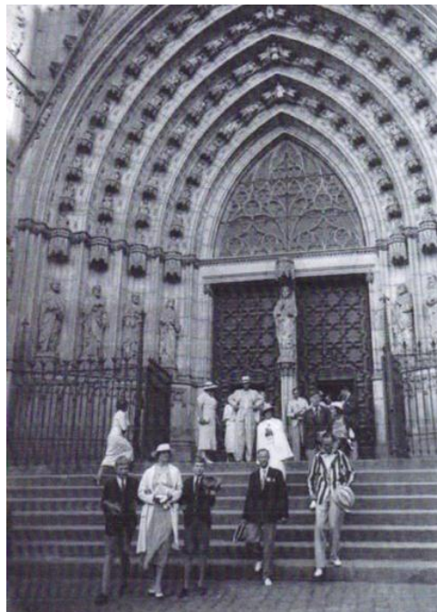
Turistes sortint de la Catedral (anys 20 o 30).

I finalment, el tercer aspecte, breument, fa referència a la celebració i participació en fires específiques de turisme tant nacionals com internacionals.