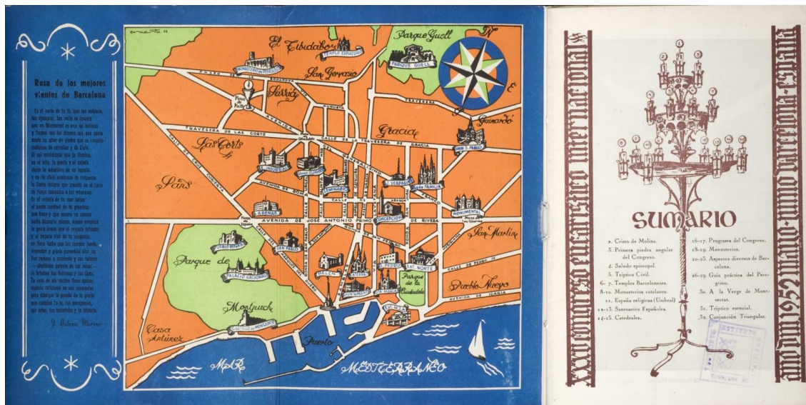
Plànol de la ciutat amb edificis i esglésies destacats, pensat per guiar els peregrins durant el XXXV Congrés Eucarístic Internacional (1952).