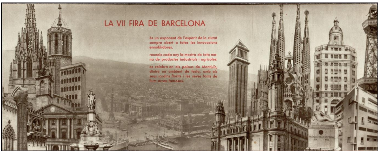
Fotomuntatge de Gabriel Casas Galobardes per a un desplegable de la VII Fira de Barcelona. Juny 1934. AHCB

Durant aquelles dècades Barcelona rebia un turisme de pas. Va rebre les visites diürnes dels turistes allotjats a la costa –que s’entretenien als toros, a la Rambla i al Poble Espanyol. Va rebre els marines de la sisena flota –que també s’entretenien, Rambla avall, i va rebre congressos, fires i convencions, un segment de mercat que s’insinuava estratègic per a la ciutat. Amb tot, l’escenari va ser més que complex, i mentre les autoritats municipals que no acabaven d’assumir ni la promoció ni molt menys la gestió turística, la política del Ministerio de Información y Turismo va permetre la proliferació d’una sèrie de tòpics que encara avui perviuen en els imaginaris col·lectius.