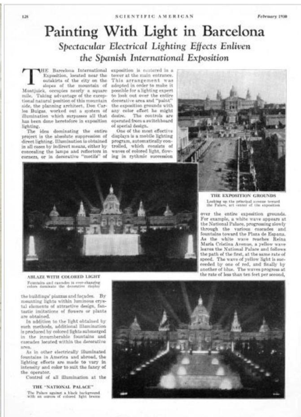
Coberta i primera pagina de l'article sobre l'Exposició a Scientific American (febrer 1930)