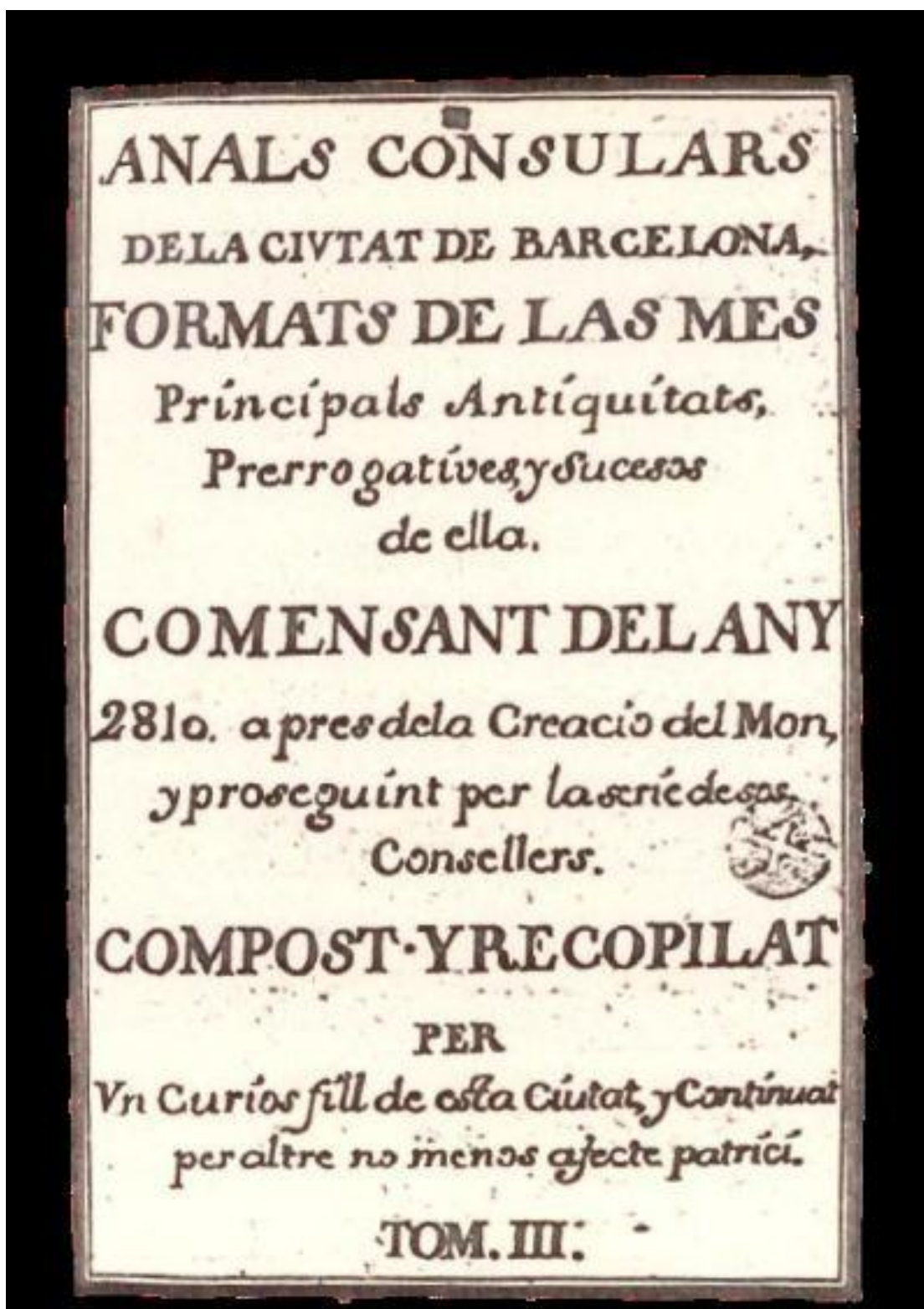
Annals consulars de la ciutat de Barcelona, formats de las més principals antiguitats, prerrogativas y successos de ella... S. XVIII, 3 volums. (BNC, Ms. 173/1-3)