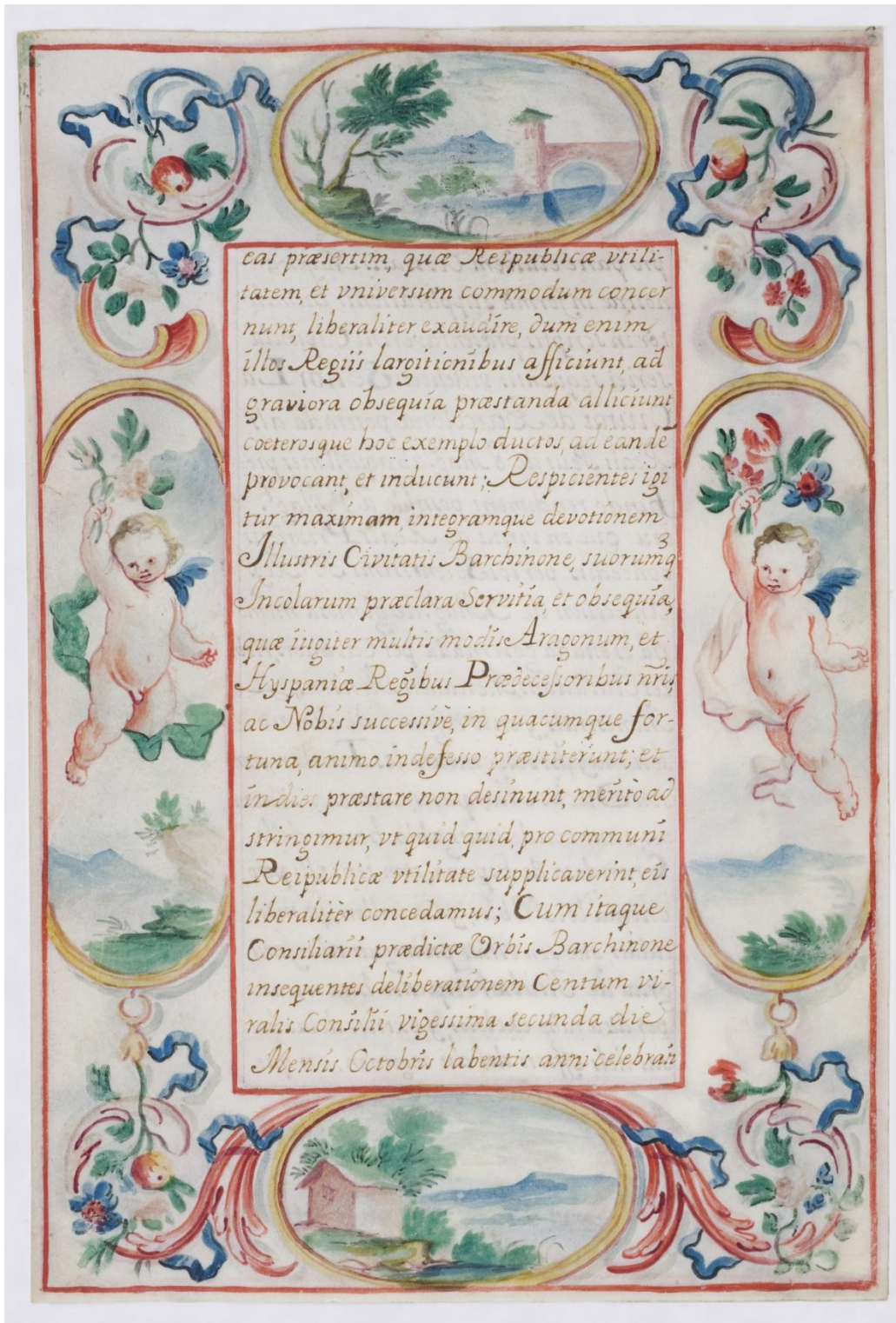
Privilegi concedit per Carles III per a la modificació de la composició de les bosses d'insaculació del Consell de Cent. 3 de novembre de 1708 (AHCB. Fons Consell de la Ciutat i Ajuntament Modern, Pergamins municipals, 1A-2634, f. 3r)