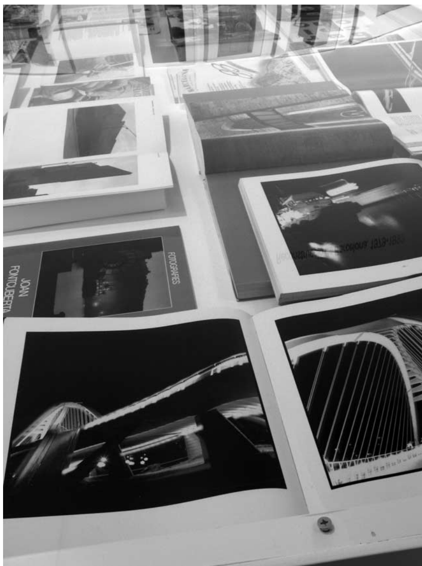
En primer plano y a la derecha, libros de Manel Esclusa. A la izquierda, libro de Joan Fontcuberta y catálogo de la exposición La ciutat fantasma (1985).