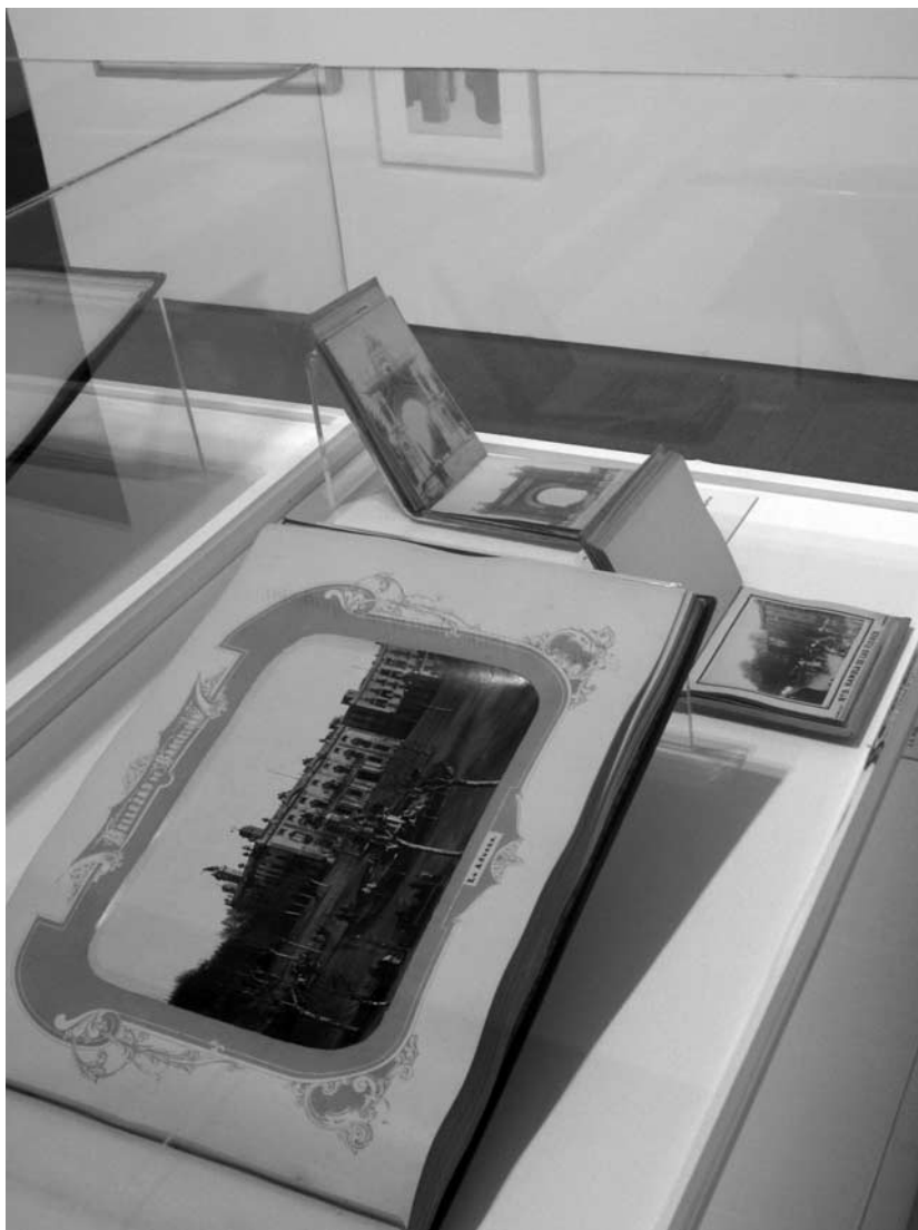
Álbumes de J. Martí, Bellezas de Barcelona (1874), J. E. Puig, Vistas de Barcelona (1887) y A. Folcrà, Recuerdo de Barcelona (1888).