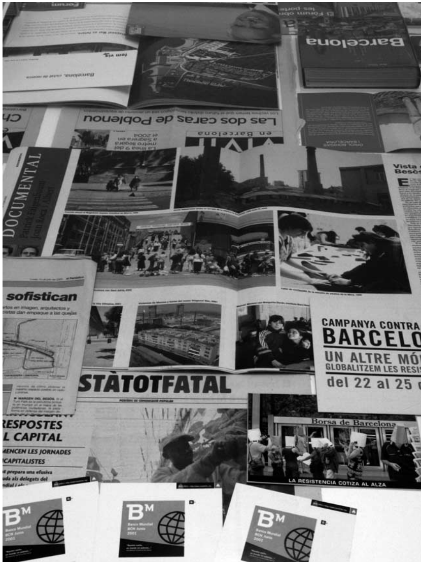
Materiales de varias campañas previas al Forum 2004.