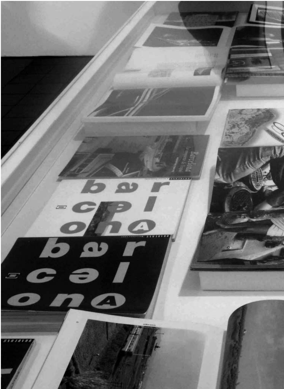
En primer plano y en el ángulo izquierdo, trilogía barcelonesa de la revista Quaderns (Collegi d'Arquitectes de Catalunya), 1990-1991. En el centro, Barcelona 92. Quinze dies d'eufòria . A la derecha, revista Artilugi y catálogos de las primeras ediciones de la Primavera Fotogràfica , 1982-1986.