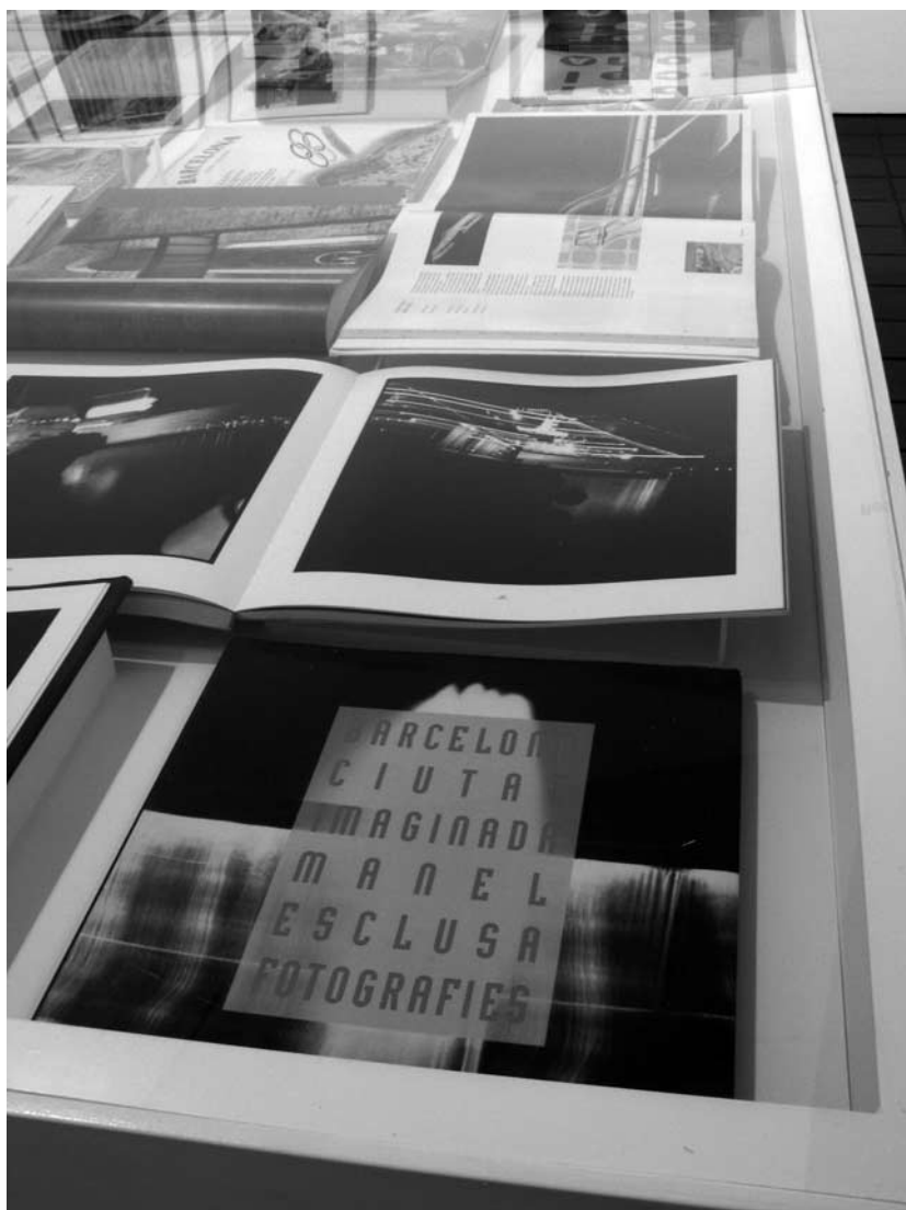
Barcelona ciutat imaginada (1988), de Manel Esclusa, y Porta d'Aigua. Deu visions del port de Barcelona (1989).