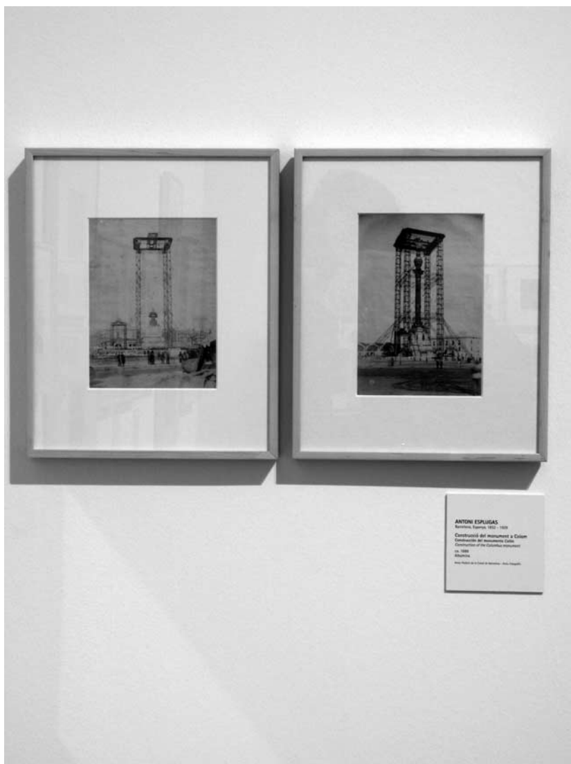
ANTONI ESPLUGAS Barcelona, España, 1852 - 1928 Construcción del monumento a Colón Construction of the Columbus Monument c. 1888