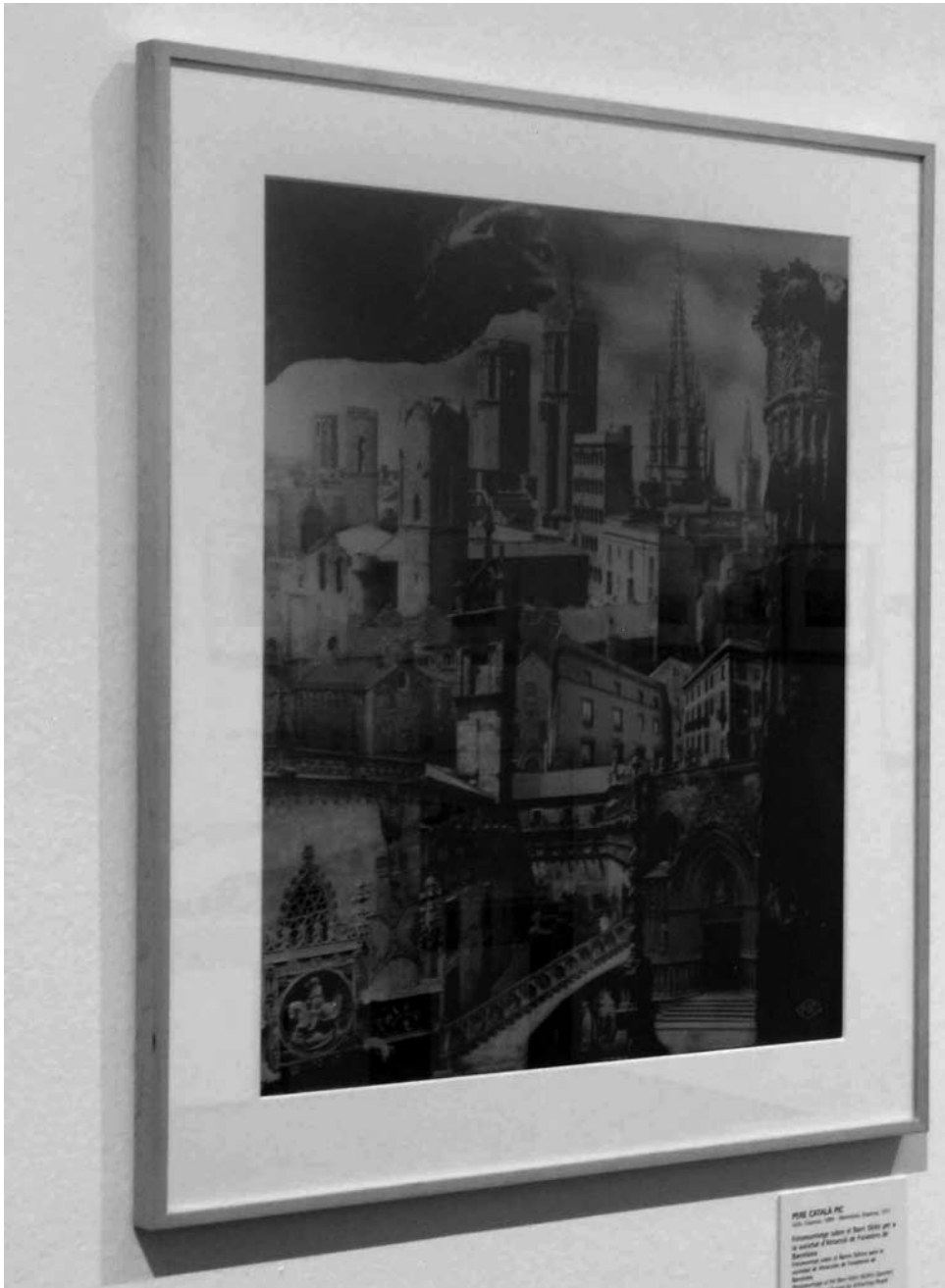
Pere Català Pic, fotomontaje sobre el Barri Gòtic para la Societat d'Atracció de Forasters de Barcelona (1935), y fotografías de Josep Brangulí sobre la Via Laietana (1930). Arxiu Fotogràfic de Barcelona.