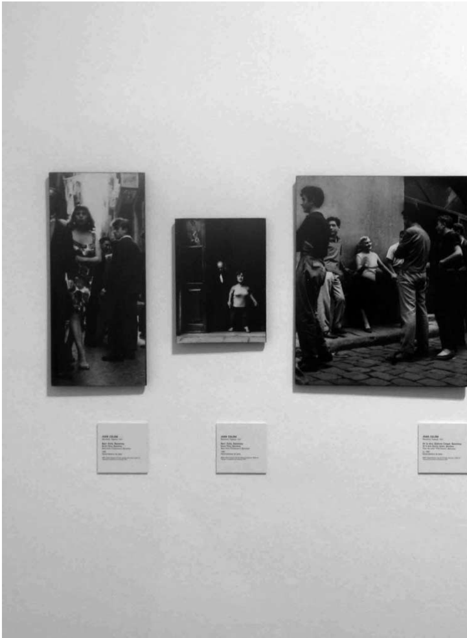
Fotografias de Joan Colom (c. 1959). Museu Nacional d'Art de Catalunya.