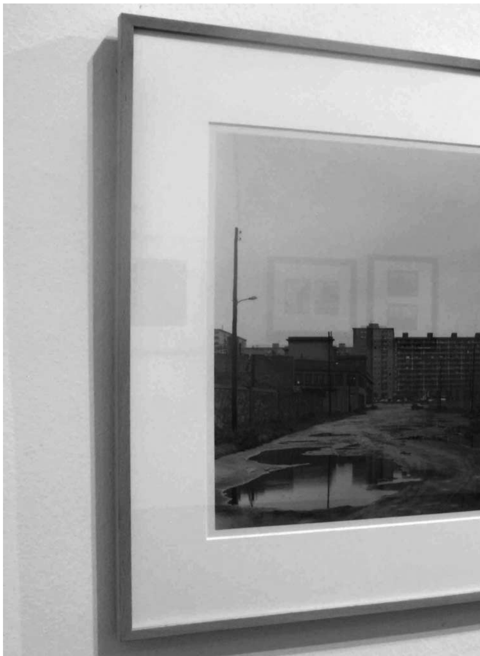
Manolo Laguillo, Nacimiento de la Diagonal (1979). Colecció MACBA. Fundació Museu d'Art Contemporani de Barcelona.