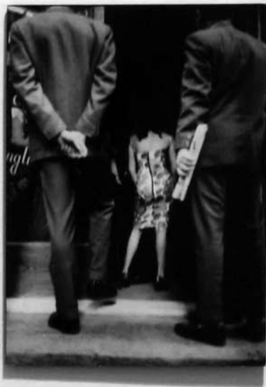
JANE FOLSON 1961 New York, New York The photograph was taken by Jane Folson in 1961. © 1961 Jane Folson