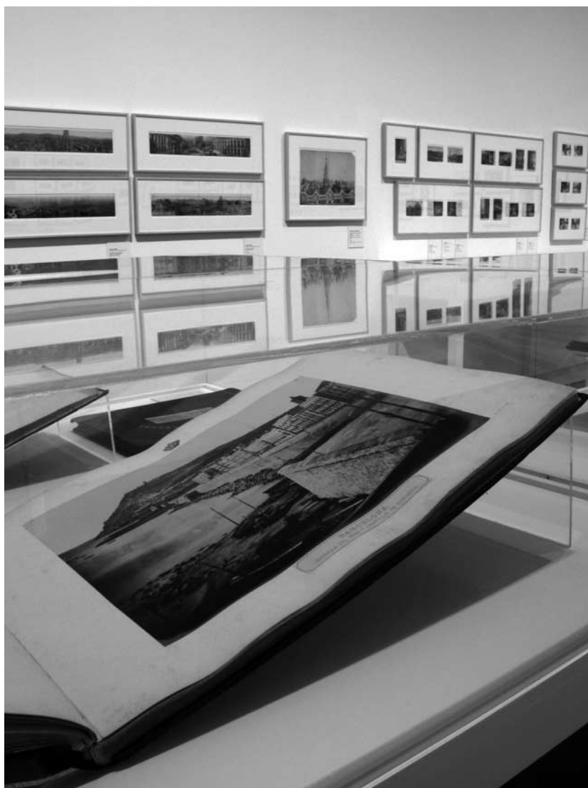
Álbum del viaje real a Aragón, Cataluña y Baleares, de Charles Clifford (1860).