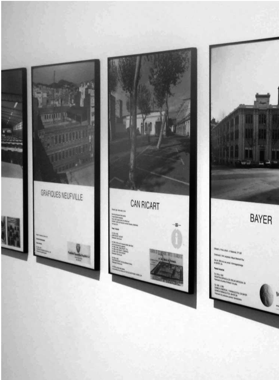
Xavier Basiana y Jaume Orpinell, Barcelona ciutat de fàbriques (2000). Detalle.