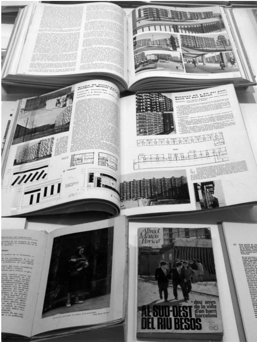
Cuadernos de arquitectura , 1965. Arxiu Històric del Col·legi d'Arquitectes de Catalunya. En primer plano, los libros Un mundo insospechado en Barcelona , de J. E. Vilaró (1945), y Al sud-est del riu Besòs , d'A. Matas Pericé (1970).