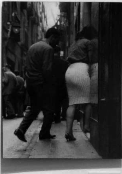
JANE FOLSON 1961 New York, New York