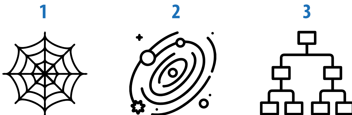
Models de tipologia d'organització fets servits pels tallers.

Es coincideix en el fet que el funcionament ideal de la Xarxa hauria de ser el de la figura 1 , per la seva horitzontalitat i interconnexió entre agents. En aquesta imatge, al centre hi hauria els objectius comuns i un grup motor d'entitats.