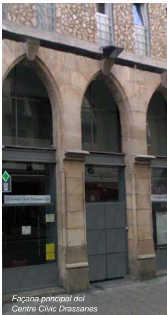
Façana principal del Centre Cívic Drassanes

Obrim les portes a tothom: qualsevol persona, grup, entitat o companyia que necessiti un lloc per desenvolupar la seva tasca, malgrat que s'atendrà especialment a les entitats o artistes ubicats a Ciutat Vella i aquells projectes que facin referència a una de les especialitats dels centres (Arts Escèniques i Noves Cultures).