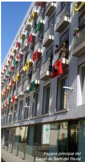
Façana principal del Casal de Barri del Raval