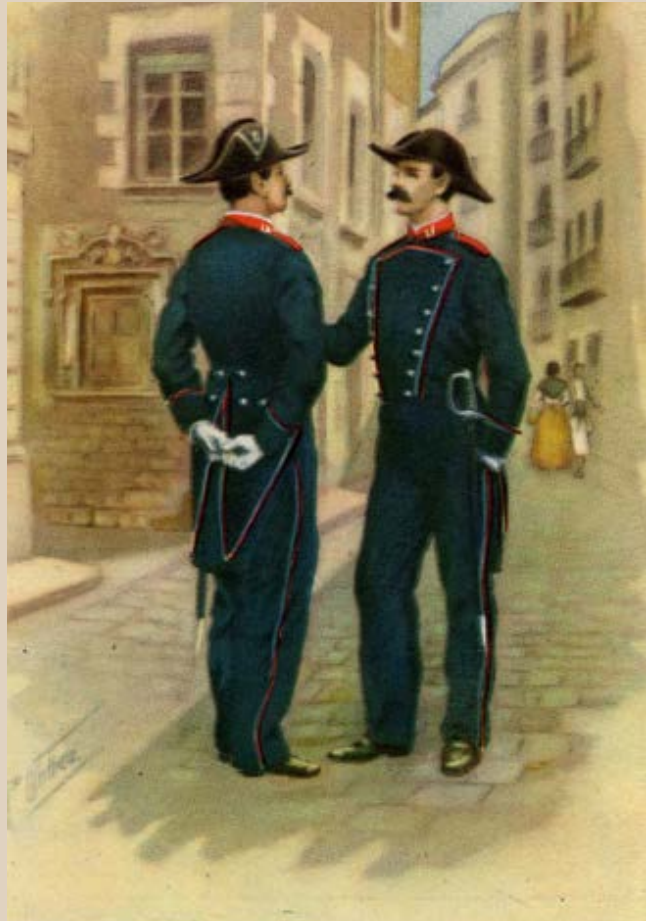
Serie segunda. - N.º 20. BARCELONA 1871. — Guardias con el nuevo uniforme de aquel año. A la izquierda, el palacio Sentmenat, de la Riera de San Juan.