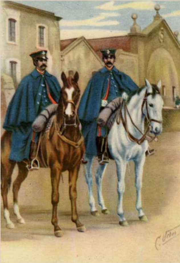
Serie segunda. - N.º 13. BARCELONA 1864. — Pareja de guardias de la Sección Montada, frente a las Atarazanas, para impedir las podreas en aquellos alrededores. Llevan el uniforme de diario de invierno.