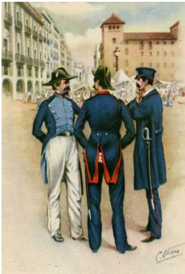
Serie primera. - N.º 9. BARCELONA 1859. — Tres guardias en la antigua plaza de San Sebastián (hoy edificio de Correos). Visten el uniforme de gala (verano e invierno) y el de servicio en invierno.