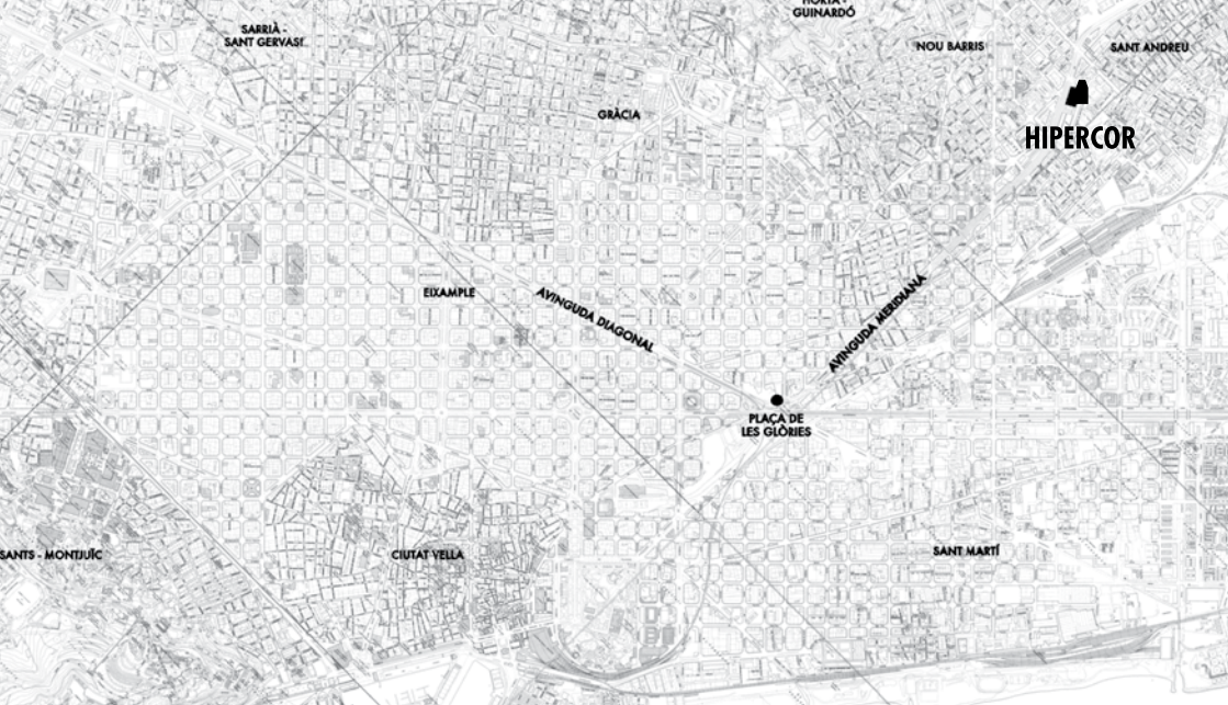
L'HIPERCOR A L'AVINGUDA MERIDIANA, 350-358 DE BARCELONA