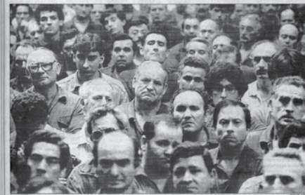
Manifestación de la fachada final de Barcelona, después del paro de cinco minutos en silencio para condenar el atentado del viernes.

Hipercor sirga que la policía hubiera solicitado la evacuación