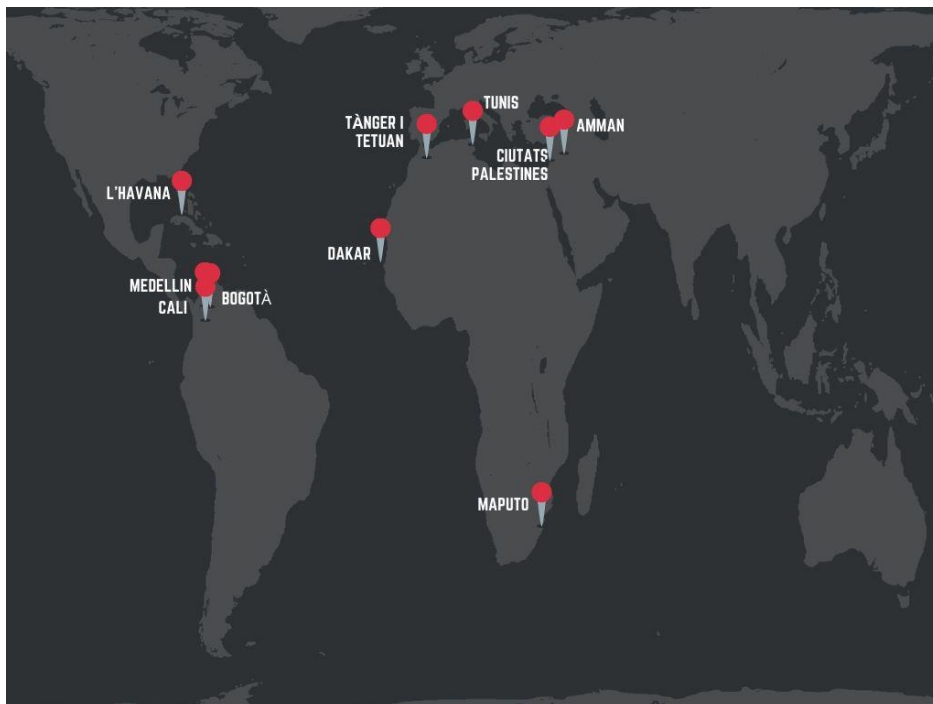
Taula 1: Distribució de recursos per ciutats.