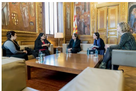
Recepció institucional de periodistes mexicanes acollides pel programa municipal

Es treballarà amb el Centre de Recursos en Drets Humans de la Direcció de Serveis de Drets de Ciutadania de l'Ajuntament de Barcelona per a reforçar la dimensió internacional del Centre, i que es pugui nodrir d'experiències de persones defensores de drets humans d'arreu.