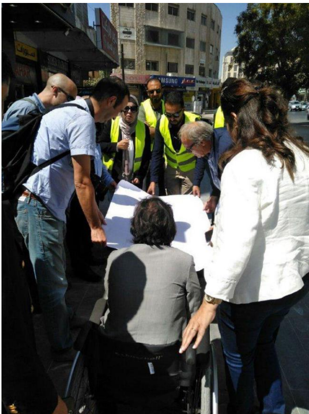
Missió tècnica a Amman per a la millora de l'accessibilitat a l'espai públic

A Amman, capital de Jordània, ciutat refugi de milers de refugiats de diversos països, es prosseguirà l'intercanvi d'experiències sobre polítiques d'inclusió de persones amb discapacitat i desenvolupament de Plans d'Accessibilitat, amb tres línies: